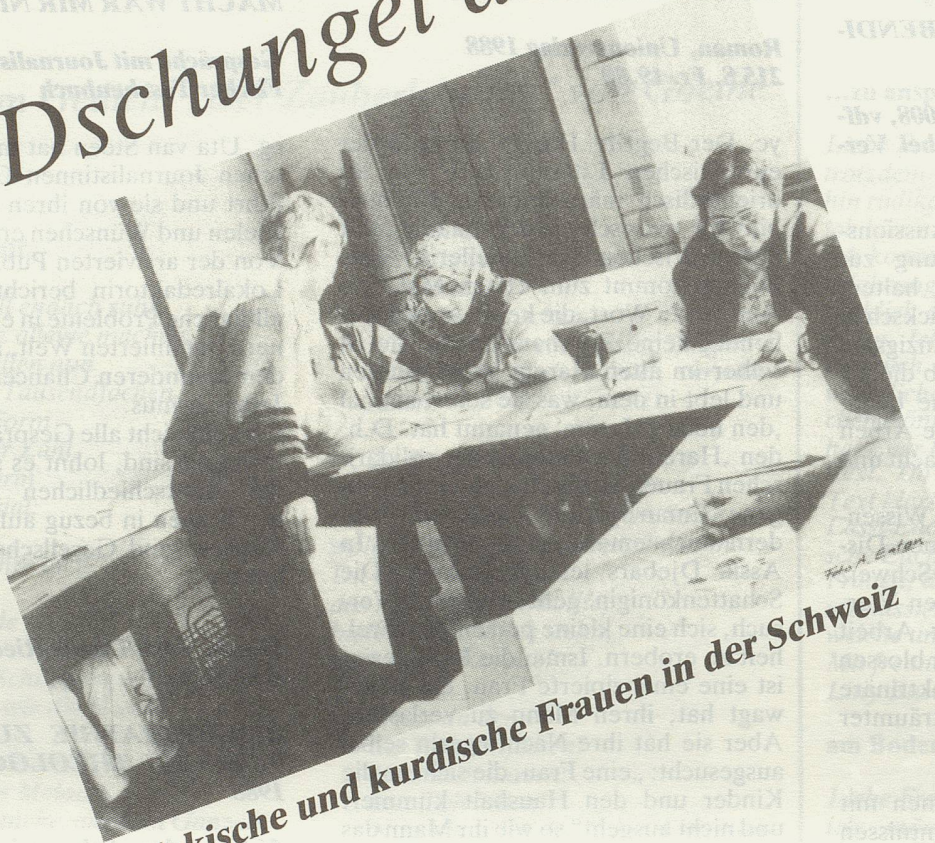
Türkische und kurdische Frauen in der Schweiz