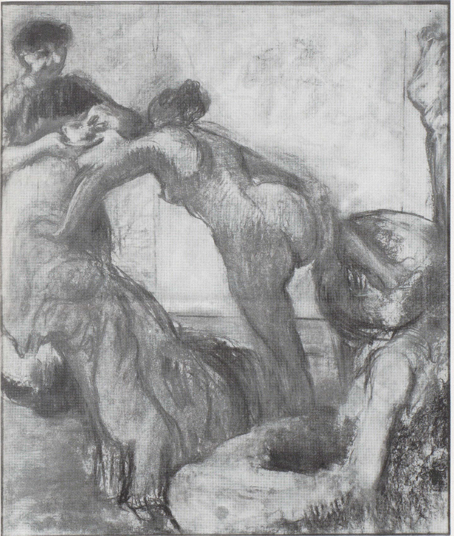
Eduard Degas, La tasse de chocolat