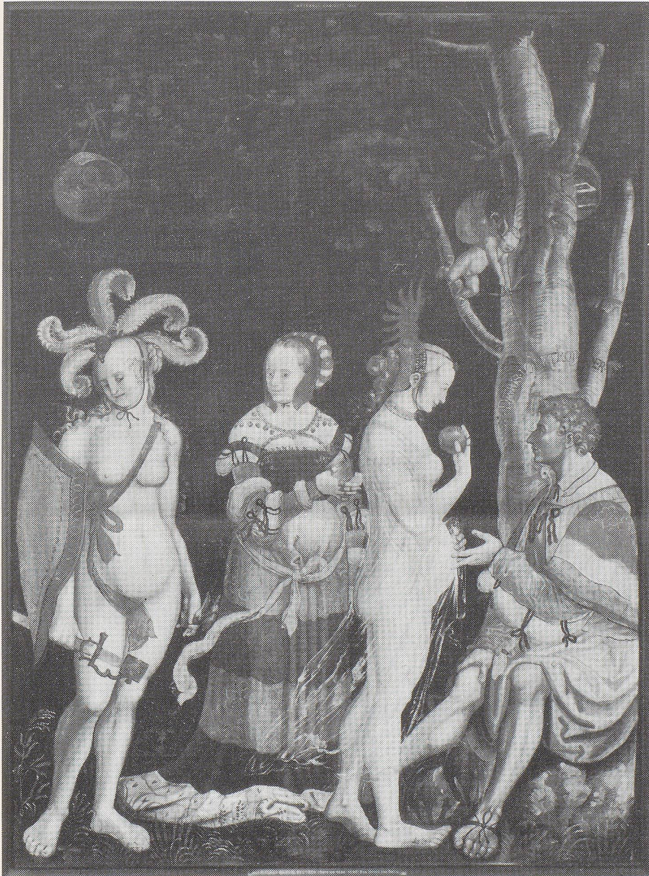
Niklaus Manuel, Das Urteil des Paris

Müssen Frauen nackt sein, um ins Museum zu kommen? Diese provokative Frage stellten die New Yorker Kunstaktivistinnen "The Guerilla Girls" an das Metropolitan Museum - stellvertretend für alle grossen Kunstmuseen der Welt. Wir haben sie an die Sammlung des Kunstmuseums in Basel gestellt und konstatieren auch hier: Weniger als 5% der KünstlerInnen sind Frauen, aber 85% aller Akte sind weiblich.