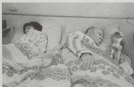
oben: Paule Baillargeon, «Le sexe des étoiles», Kanada 1993