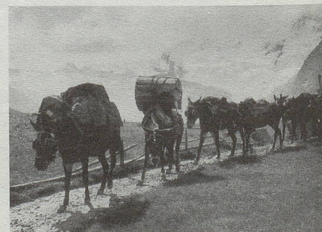
Komm mit ins Wallis – Maultierpost von Saas-Fee nach Saas-Grund in den Dreissigerjahren. (Printed in Switzerland – Imprimé en Suisse)

Noch ein kulturelles PS: Im neuen Ortseum von Raron, jenem hübschen Städtchen nahe Visp, in dem Rilke begraben liegt, hat Iris von Rothen ein Zimmer für sich allein erhalten. Sie lebte und arbeitete halb in Raron, halb in Basel. (Museum auf der Burg, vom 1. Mai bis 30. September täglich geöffnet von 10–16 h, im April und Oktober nach Voranmeldung, Tel. 028/44 29 69.)