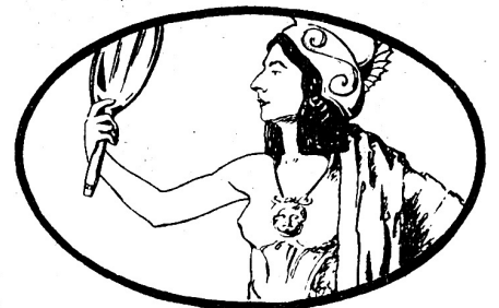
Preis M 1.50

In knappen, unterhaltenden Aufsätzen, werden kulturelle Schilderungen aus dem Sittenleben aller Völker und aller Zeiten gegeben und auf den Wechsel zwischen Sitte und Sittlichkeit und die schwache Basis unserer Moralgesetze hingewiesen.