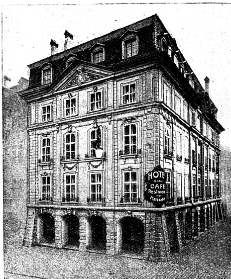
Hotel und Café-Restaurant Ratskeller Vereinslokal der Ortsgruppe Bern

entstand das sehr malerische Nydeckquartier, mit der alten Nydeckkirche zur Mitte, wie das Titelbild zeigt, welches jedem Stadtfremden zur Besichtigung empfohlen wird. Eine Tafel an der Kirche besagt, dass die Grundmauern der Kirche der alten Burg Nydeck angehörten. Jenseits der Aare, über welche die Nydeckbrücke führt, befindet sich der Bärengraben, der die Wappentiere der Bundestadt enthält, zur Zeit deren 12. Im mittleren Strassenzuge der Altstadt bildeten sich die alten noch heute bestehenden Zunfthäuser, gekennzeichnet durch die Wappentafeln an der Hausfassade. Auch unser Vereinslokal, das Hotel-Restaurant Ratskeller, das sich in dieser Strasse befindet, hat historischen Charakter. Es war das Haus des letzten bernischen Vogtes. Zu mittelalterl. Zeit wurden hier (Kreuzgasse) öffentlich die