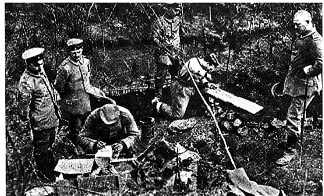
Soldaten zimmern Grabkreuze

«Die erste Pflicht der Kirche war bei Beginn des Krieges, das Schwert des Geistes zu nehmen, welches ist das Wort Gottes. Der König der Könige rief ins Heiligtum, und alle kamen, wenigstens sehr, sehr viele kamen und viele blieben auch einmütig im Gotteshause, zum Hören und im Gebet. Die Ladung der Diener am Wort fand williges und allgemeines Entsprechen ... Es war dies eine Zeit erhebender Erfahrung, dass Gottes Wort noch eine Grossmacht ist und wertgehalten im deutschen Volke.»