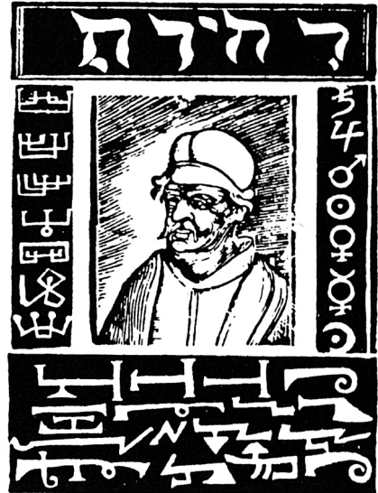
Titelblatt von Abanos Telefonbuch

Sehr zum Ärger der Inquisition riefen geistliche Herren und Damen bald schon nicht mehr nur gut-christliche Geister mit dieser neuen Erfindung zu sich, sondern häufig auch die in einem Callgirl- bzw. Callboy-Ring zusammengeschlossenen, berüch-