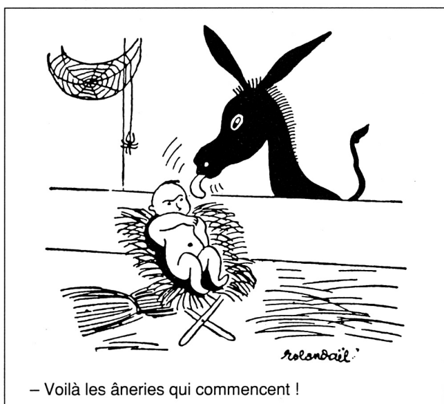
Aus der satirischen Monatsschrift «La calotte»

Die 20er und 30er Jahre waren Krisenzeiten mit Massenarbeitslosigkeit, bester Nährboden für extremes Gedankengut. Dies machten sich auch Faschisten und Nationalsozialisten zunutze und versprachen der Arbeiterschaft das Blaue vom Himmel. Auf der einen Seite entstand Hoffnung auf Erlösung, auf der anderen Seite Angst vor ideeller Versklavung. Das französische Volk reagierte und gab sich eine Regierung der