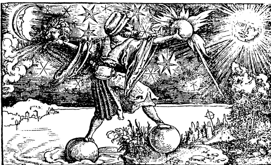
Der Mensch, eingeordnet in das System der vier Elemente Feuer (rechts oben), Wasser (links unten), Erde (rechts unten) und Luft (links oben); zusätzlich bestimmen noch Sonne, Mond, die Planeten und die anderen Gestirne das «Schicksal» (Petrarca-Meister 1514–1536, gedruckt 1572).

Die Götter bilden miteinander Winkel, manche wirken harmonisch, andere rufen nach Entspannung. Mittels der humanisierten Eigenschaften der sich vor der universellen Kulisse bewegenden Eckpunkte bestimmen die Astrologen, über die Ekliptik ein Spinnernetz spannend, die «Qualität» der Zeit. R. O.