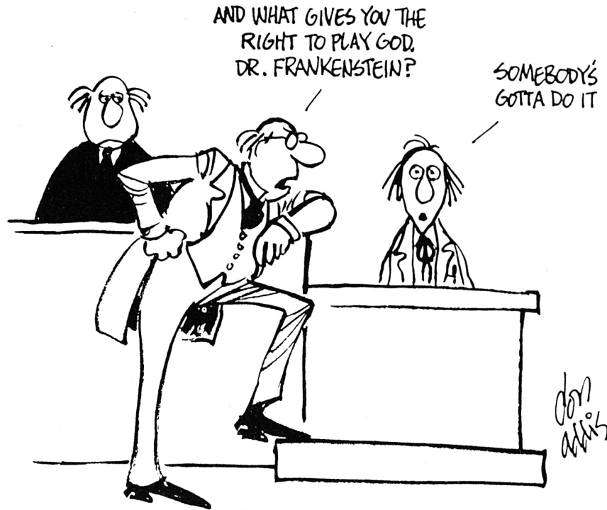
«UND WAS GIBT IHNEN DAS RECHT, GOTT ZU SPIELEN, DR. FRANKENSTEIN?» «JEMAND MUSS ES DOCH TUN.» Aus dem «Free Inquiry», Fall 1994, Vol. 14, No. 4.

Leute, deren heissblütiger «Antirassismus» nur den Aggregatzustand ihres in die Defensive gedrängten, derzeit nicht salonfähigen und somit nicht opportunen Rassismus darstellt, sind süchtig nach dem Wort «Rasse». Sie finden «Rasse» pikant. Das krampfhaftes Festhalten an einem rassistischen Begriff erleichtert ihnen die «antirassistische» Maskerade. D. Red.