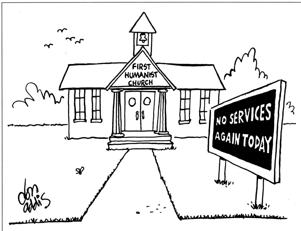
"Erste Humanistische Kirche", "Heute wieder kein Gottesdienst" aus Free Inquiry, Herbst 1996

Mit Wahrscheinlichkeiten umgehen und Unsicherheiten aushalten lernen, dies ist heute geboten. Das