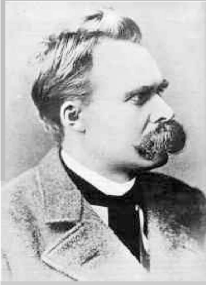
Friedrich Nietzsche 1844-1900