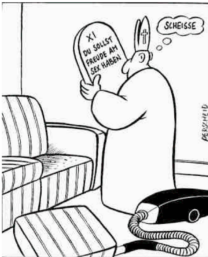
Der Papst findet das 11. Gebot.