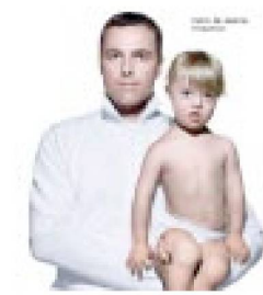
Wir lassen uns nicht behindern

* http://www.rhetorik.ch/Aktuell/Aktuell_Oct_11_2003.html