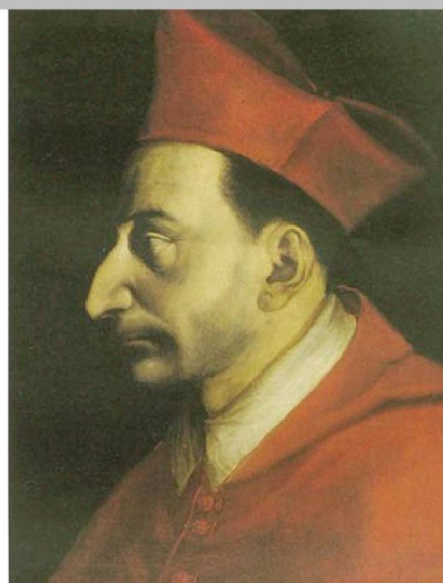
Carlo Borromeo (1539-1584)

Nella turrita Bellinzona, dove ormai respirava un'aura casalinga, ben protetto da una forte cerchia di mura, Carlo Borromeo non si sprecò in vanità lontane dalla sua vocazione di