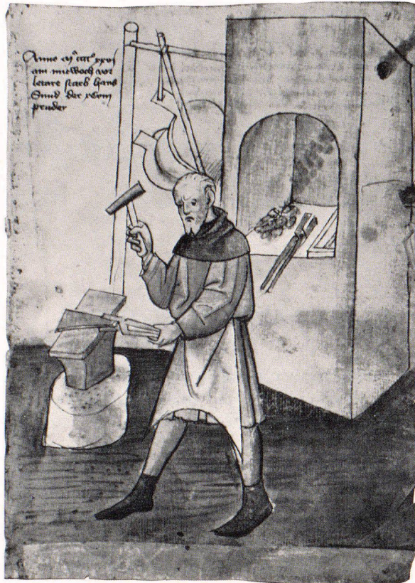
Aus dem Hausbuch der Mendelschen Zwölfbrüderstiftung in Nürnberg. Stadtbibliothek Nürnberg