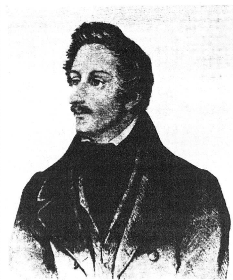
Karl Gutzkow, wahrer Autor der «Zeitgenossen»

Popularisierung des binären Zahlensystems für den Alltagsgebrauch. Die Erfindung seiner Fahrmaschine, eines vierrädrigen Muskelkraftwagens, ist vermutlich durch damals publizierte Theorien des Fuhrwerks angeregt. Mit der Laufmaschine 1817 wagt er auf dem Hintergrund der zeitgenössischen Schlittschuheurphorie das einspurige Balancieren auf Rädern. Die sogleich weltweit bekannte Erfindung war damals nur unvollständig