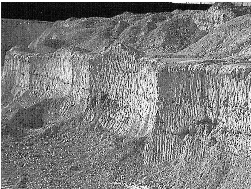
Kreidefeuersteinlagen in der Schreibkreide von Mön.

Feuersteins, das heisst, dass alle Feuersteine, welche als sekundäre Ablagerung auf der Erdoberfläche liegen, kaum als Werkstoff verwendet werden können. Auch diejenigen, die geologisch durch tektonische Störungen Druckrisse erhalten haben, sind unbrauchbar. Die gute Qualität wurde deshalb im Berginnern gesucht und im Tagbau oder Untertagbau gefördert. Bergbau im Neolithikum weist eindeutig darauf hin, dass der wichtige Rohstoff Feuerstein der Stahl der Steine war.