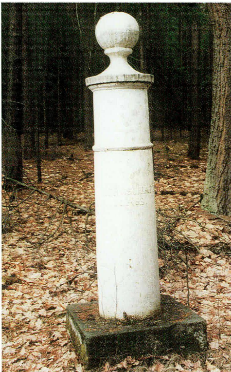
Abb. 10: Gusseisenprellstein der Metternichschen Herrschaft Plasy (Plass).

Als ein Beispiel einstigen städtischen Gusseiseninventars liesse sich die öffentliche Pumpe in Rokycany (Rokytzan) anführen, die im letzten Drittel des 19. Jahrhunderts von der Firma R. A. Smékal, Prag, offensichtlich in Gemeinschaftsarbeit mit den Eisenwerken Blansko, gebaut wurde (Abb. 9). Hier handelt es sich um eine etwas humorvolle Guss-eisenkomposition, bestehend aus der eigentlichen Schöpfleinrichtung und einer offenbar für einen anderen Brunnen entworfenen gusseisernen Figur (Plastik einer Frau mit Amphore), deren Spitze von einer Gusseisenlaterne gekrönt wird. Den Betrachter dieses Kunstwerkes überfallen geradezu lustige Gedanken bei der Vorstellung, was sich an der Laterne oben wohl sonst noch alles anbringen liesse.