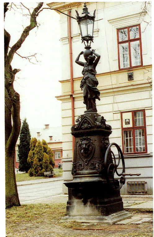
Abb. 9: Brunnen mit Schöpfwerk in Rokycany (Rokyžtan).

Das städtische Interieur war im vergangenen Jahrhundert buchstäblich überschwemmt mit Gusseisen, welches insbesondere für die Hausausstattung Verwendung fand. Es wurden Klinken, Schilder, Säulen, Geländer, Lichthofgitter, Leuchtungskörper, Fensterparapets usw. daraus hergestellt. Den Strassenraum belebten in Gusseisen bearbeitete Orientierungstafeln, Hinweisschilder, Prellsteine, Schutzgitter rund um die