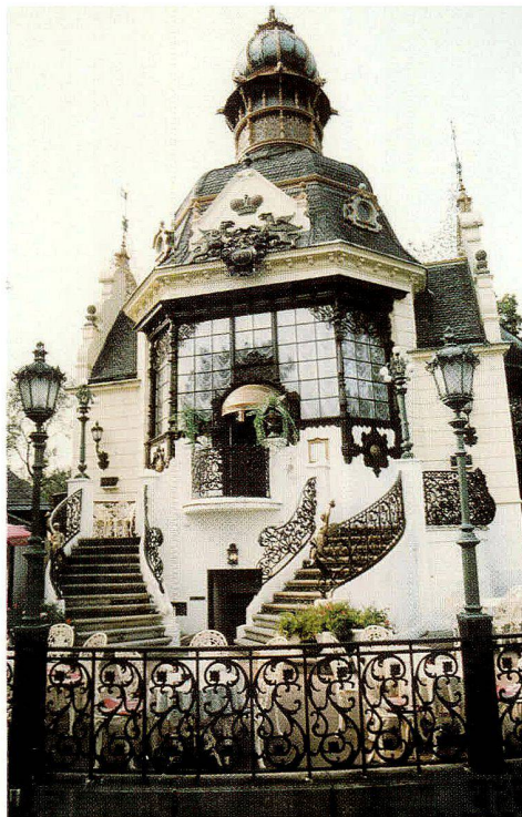
Abb. 7: Hannauer Pavillon in Prag.

Als Gusseisenbau weniger bekannt ist z.B. der Zuschauerraum des Ständetheaters, der 108 mit Ornamenten verzierte Gusseisenpfeiler aufweist, welche die Galerie tragen. Diese Säulen ersetzten in einer unübertroffen kurzen Zeit von 5 Monaten seit der Auftragserteilung bei der Rekonstruktion des Theaters die ursprünglichen, nur in Holz ausgeführten Konstruktionen (1859). Dies wurde gerade dank der gewählten Technologie und konstruktiven Lösung von Gusseisensäulen und Tragbalkenbindern möglich.