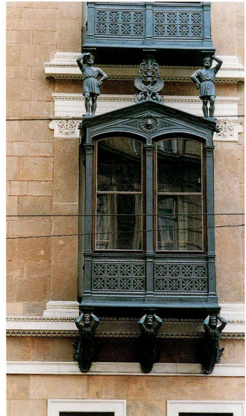
Abb. 6: Gusseisenerker mit Figuralschmuck am Klein-Palais in Brünn (nach einem Entwurf des Architekten Ludwig v. Förster)

Gestalt von Hallenbauten immer noch in weiteren Beispielen erhalten. Es sei stellvertretend für andere, z.B. die Abfertigungshalle des Masaryk-Bahnhofs mit ihrem Gusseisenportal und ihren Pfeilern genannt, die in der Zeit der Erweiterung des Objektes im Jahre 1866 entstand (Abb. 5). Der Bahnhof ist der älteste Prager Bahnhof; er wurde bereits im Jahr 1845 erbaut.