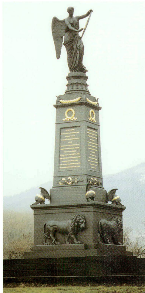
Abb. 1: Gusseisendenkmal zur Erinnerung an die Teilnahme russischer Truppen an der antifranzösischen Koalition in der Schlacht gegen Napoleons Heere 1813 bei Přestanov (Priesten).

Ein zweites Objekt stellt das Gusseisendenkmal bei Přestanov (Priesten) dar, das zum Gedächtnis an die Teilnahme russischer Truppen an der Antinapoleon-Koalition errichtet wurde (Abb. 1).