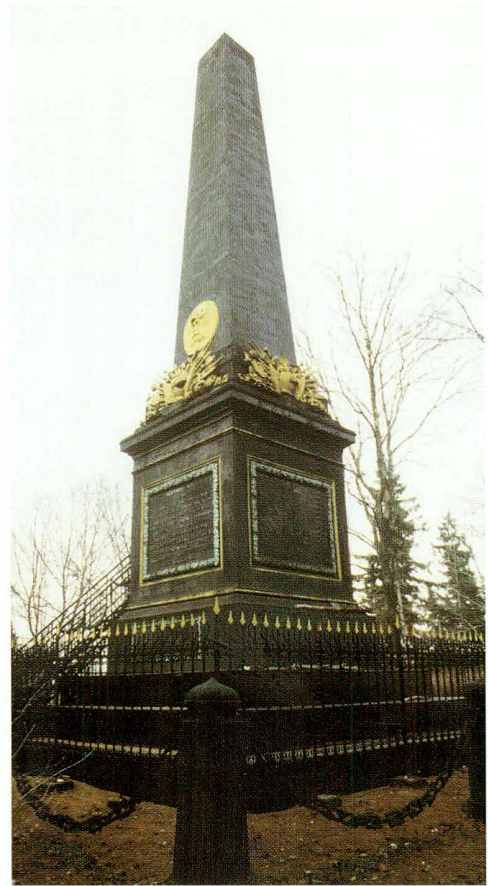
Abb. 2: Gusseisendenkmal, das an die Schlacht bei Trutnov (Trautenau) während des preussisch-österreichischen Krieges 1866 erinnert.

Bei diesem Denkmal dürfte es sich um das schönste Beispiel der Verwendung von Eisen in der monumentalen Denkmalplastik in Böhmen handeln. Es hat die Gestalt eines 12 Meter hohen Obeliskens, der die Siegesgöttin trägt. Der Entwurf dieses Kunstwerkes geht – die eventuelle Teilnahme von Václav Prachner an seinem Zustandekommen darf nur angenommen werden – auf den Architekten Nobile zurück. Die Plastik wurde von den Eisenwerken von Horzowitz im Jahre 1836 gegossen.