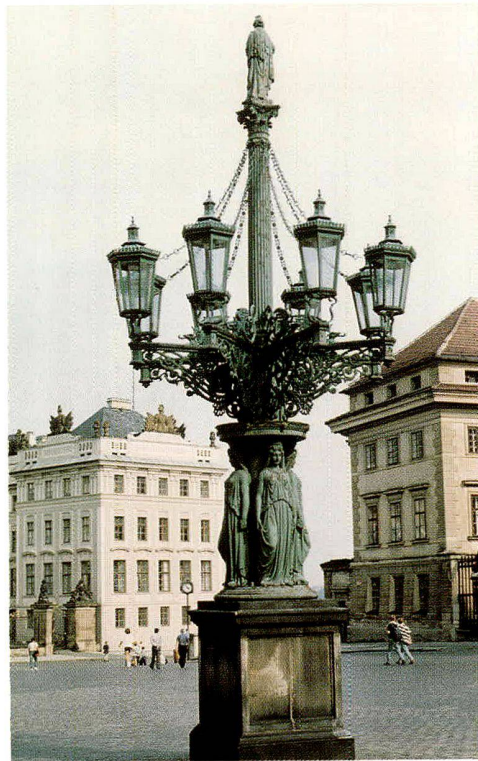
Abb. 8: Säule der Festbeleuchtung auf dem Hradschinerplatz in Prag.

Als ein anderes Beispiel lassen sich die Gusseisenleuchten anführen, die eigens zur Vollendung der Architektur der wichtigsten Prager Objekte, des Rudolfinums, des Nationaltheaters, des Nationalmuseums usw. entworfen wurden. Unser Beispiel, der vor dem Rudolfinum aufgestellte Kandelaber, stammt aus den Eisenwerken von Horzowitz, wo er nach einem Entwurf des Architekten Schulz in den 70er Jahren des 19. Jahrhunderts gegossen wurde.