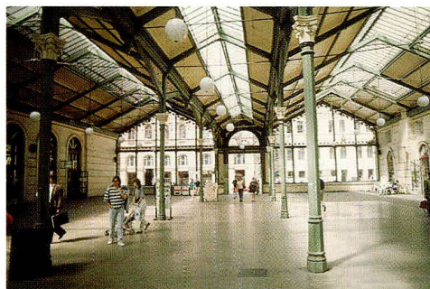
Abb. 5: Abfertigungshalle des Masaryk-Bahnhofs in Prag.

Die Konstruktionen dieses Typs erfreuten sich ziemlicher Beliebtheit. Sie fanden beachtliche Verbreitung und sind uns in