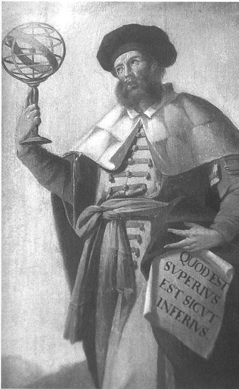
Abb. 2: Hermes Trismegistos, um 1740, aus: M. Bachmann, Th. Hofmeier: Geheimnisse der Alchemie , Basel 1999.

dem spezialisierten Handwerkertum fabrikähnliche Formen; auf dem Gebiet des Befestigungswesens, der Wasserversorgung, des Bergbaus und vor allem der Schifffahrt sind bedeutende technische Leistungen zu verzeichnen. Die Natur ist hier insofern Vorbild, als dass man die zunächst empirisch erkundeten, später theoretisch reflektierten Naturgesetze mechanisch zu nutzen und – wie z.B. bei der Urform des Astrolabs die Kreisbahnen der Gestirne – veranschaulichend nachzubilden versucht. Die Erfindungs-Schritte können am Beispiel der tiergetriebenen Erntemaschine («carpentum») verdeutlicht werden: Hand – Kamm – gezählter, schneidender Breitkamm – Montage auf Rädern – Bewegung durch ein (vorwärts stossendes!) Zugtier (Abb. 3). In einen solchen Zusammenhang sind auch die technischen «Spielzeuge» wie z.B. die Puppentheater-Automaten Herons von Alexandria, 31 zu stellen.