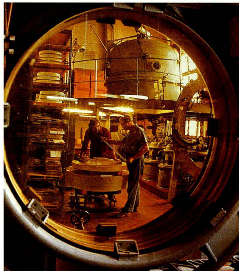
Endbearbeitung eines Teleskopspiegels im VEB Carl Zeiss Jena.

18 Zur Geschichte des Betriebes VEB Waggonbau Niesky, o.O. 1957; Otto Gericke/Manfred Wille: Von der alten Bude zum faschistischen Konzern.