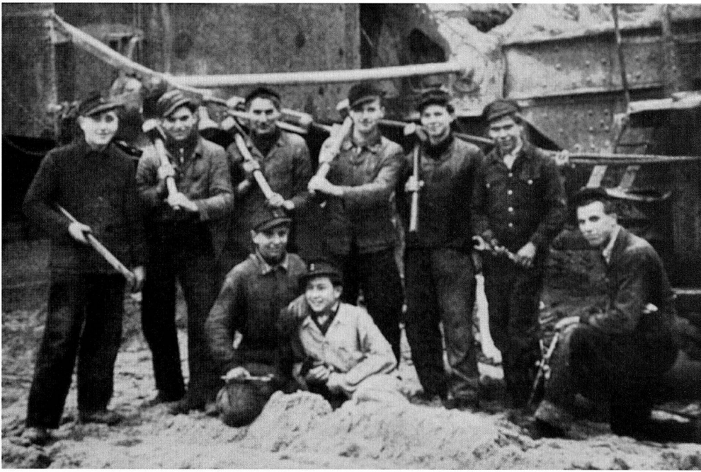
Jugendstossbrigade aus dem Tagebau Kleinleipisch bei ihrem Einsatz im Juli 1948.

5. Die veröffentlichten Betriebsgeschichten spiegeln in qualitativ unterschiedlichem Masse das jeweilige in der DDR herrschende bzw. gewünschte Geschichtsbild wider. Dieses Bild hatte sich allerdings unter dem Einfluss der SED-Propaganda immer wieder verändert. Das ist an der Diktion der Darstellungen ebenso festzustellen wie an den inhaltlichen Schwerpunkten. Die Entstehungsart der Publikationen liess auch – unabhängig von der subjektiven Absicht der Autoren – keine andere Möglichkeit zu. Das Handbuch zur Betriebsgeschichte gab in seinem zweiten Teil das gewünschte Bild vor. Dort konnte der Betriebshistoriker nachlesen, worauf er bei der Erforschung und Darstellung in den einzelnen Geschichtsperioden zu achten hatte. Damit waren zwei inhaltliche Konsequenzen verbunden. Zum einen bestand immer die Ansicht, mit den Betriebsgeschichten zur Vermittlung des gängigen Geschichtsbildes beizutragen. Das geschah mit unterschiedlichem Geschick. Manche Betriebsgeschichte stellte einen Abriss der DDR-Geschichte dar, die mit betriebspezifischen Informationen angereichert war. Zum anderen verstellte oder behinderte diese Aufgabenstellung den kritischen Blick sowohl auf die DDR-Geschichte als auch auf die betrieblichen Vorgänge.