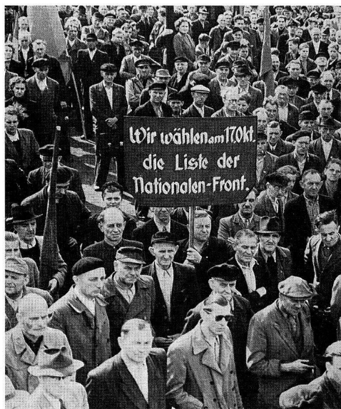
Kundgebung der Belegschaft des VEB Leuna-Werke «Walter Ulbricht» zur Verleihung der Ministerratsfahne am 20. September 1954. Am 17. Oktober 1954 fanden in der DDR Wahlen zur Volkskammer statt.

kraten zu. Wenn sie als Betriebsräte oder Gewerkschaftsfunktionäre vor 1933 und zwischen 1945 und 1948 nicht der radikalen Position der KPD bzw. der SED gefolgt waren, wurde ihre Existenz entweder verschwiegen, oder sie wurden politisch diffamiert. Der dritte Mangel zeigt sich darin, dass in den Geschichten der Staatsbetriebe der Eindruck erweckt wurde, die SED-Betriebsparteiorganisationen, insbesondere aber ihre Leitungen, haben eigentlich die Betriebe geführt. Damit sollte der Nachweis erbracht werden, dass die SED-Parteiorganisationen die führende Rolle in den Betrieben ausübten. Bei genauem Hinsehen zeigt sich, dass es nicht der Parteileitungen bedurfte, um in den Betrieben die richtigen Entscheidungen zu treffen, denn die Fachleute wussten selbst, was zu tun war. Die Parteileitungen mussten sich ohnehin auf deren Auskünfte stützen, wenn sie einen fachlich ausgerichteten Beschluss fassen wollten. Vielmehr war es oft umgekehrt. Die Betriebsfunktionäre, die Wissenschaftler und Ingenieure nutzten Parteitags- und ZK-Beschlüsse, um ein angestautes Problem rascher zu lösen. Ein treffendes Beispiel für diese Art von Betriebsgeschichtsschreibung ist die «Geschichte des VEB Leuna-Werke «Walter Ulbricht» 1945–1981», die 1986 erschienen ist. 24