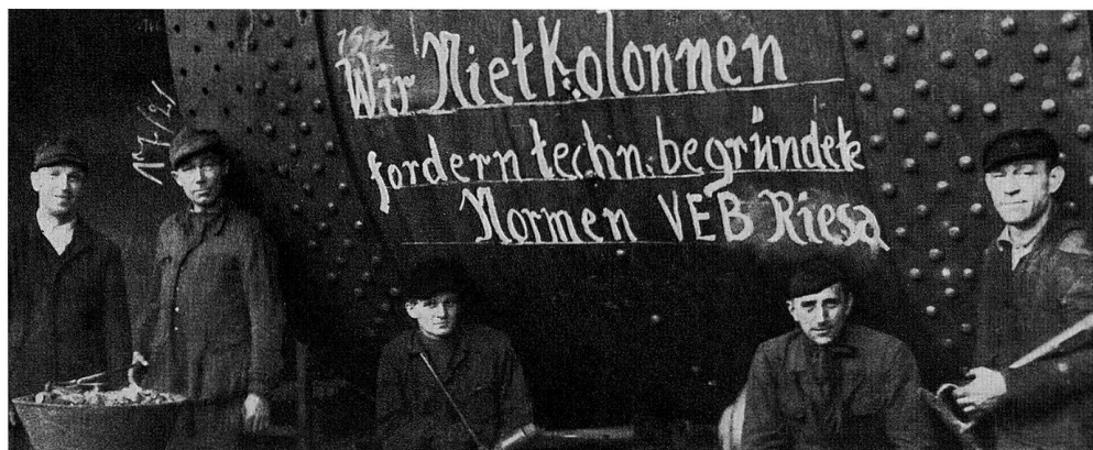
Aktivisten des Jahres 1948 im Stahlbau, Stahl- und Walzwerk Riesa.

an der Niederschrift der Endfassung zu beteiligen. Dadurch wurde nicht nur das Interesse an dem Vorhaben in der Belegschaft geweckt, sondern auch vieles, das sich in keinem Archiv fand, zutage gefördert. Da aber in zunehmendem Masse die Betriebsparteiorganisationen der SED die Konzeptionen vorgaben, kam es bei der Niederschrift der einzelnen Passagen und des Gesamtmanuskriptes immer wieder zu Auseinandersetzungen über die Bewertung betrieblicher Vorgänge, die zumeist zu inhaltlichen Verlusten führten, denn die Betriebsgeschichten konnten nur dann erscheinen, wenn der gesamte Text von den Parteiinstanzen gebilligt worden war.