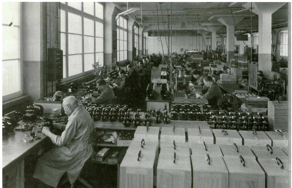
Mikrostativ-Montage im VEB Carl Zeiss Jena 1954.

4. Die Betriebsgeschichten wurden in der Regel mit Blick auf die Belegschaften geschrieben. Das bestimmte den Stil, die Ausgestaltung usw. Die Verfasser hatten nur in seltenen Fällen ausschliesslich Fachhistoriker im Auge. Etwas anders verhielt es sich mit akademischen Qualifizierungsschriften mit betriebsgeschichtlichen Themen. Überhaupt gibt es aus geschichtswissenschaftlicher Sicht grosse qualitative Unterschiede zwischen den Darstellungen und oftmals auch innerhalb der Betriebsgeschichten. Neben informativen und gut geschriebenen Darstellungen finden sich auch nicht wenige, die für den Interessierten nur von geringem Wert sind. Verschiedentlich beschränken sich Betriebe auf die Veröffentlichung von chronologischen Übersichten. 23