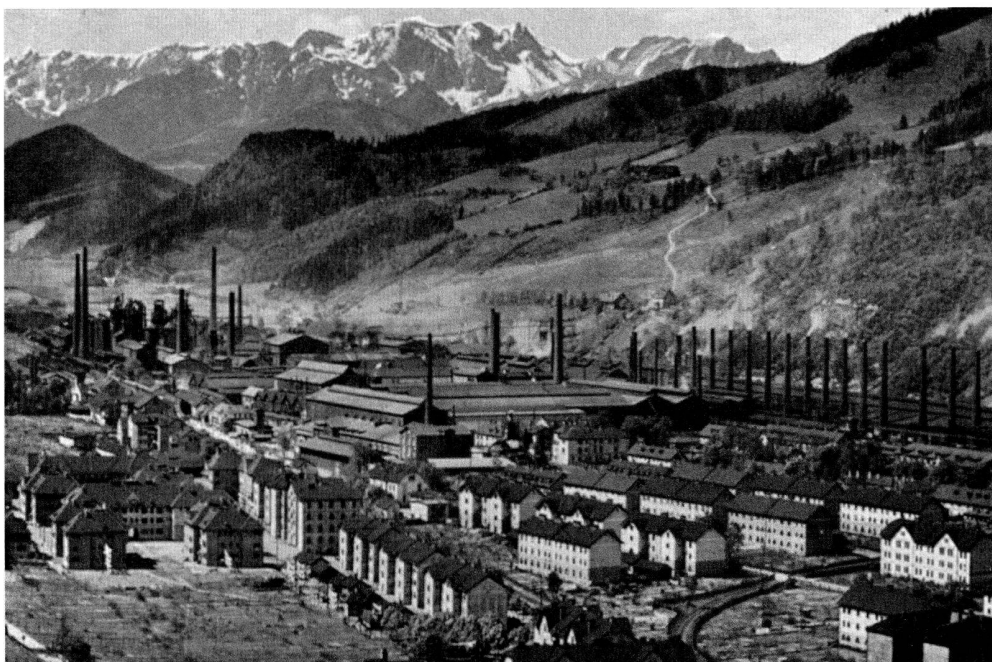
Das Werk Donawitz (Steiermark) der ÖMAG um 1930, Gesamtanlage von Süden. Die Schlotreihe rechts gehört zum Martin-Stahlwerk, in der Mitte das Feinwalzwerk, die Kraftzentrale, dahinter das Neue Blechwalzwerk, im Hintergrund links die Hochofenanlage. (aus: Kloepfer, Hans; Rihel, Hans: Das steirische Eisenbuch. Graz 1937, S. 49)

der von der ÖAMG initiierten und konzipierten und alle wesentlichen Aspekte der unternehmerischen Aspekte umfassenden Geschichte des Konzerns zu ihrem 50-Jahr-Jubiläum im Jahre 1931 gilt eine vergleichende und wissenschaftlichen Ansprüchen genügende Geschichte der österreichischen Montanindustrie und der ÖAMG als bedeutendstem Unternehmen dieser Branche als Forschungsdesiderat. 15 Die wenigen in den frühen 1980er Jahren erschienenen, knappen Beiträge zur Konzerngeschichte bis 1938 16 und zur Rolle der ÖAMG in der Rüstungsindustrie 1938 – 1945 17 fanden lange keine Nachfolger. Das 100-Jahr-Jubiläum des Konzerns verstrich 1981 ohne entsprechende Aktivitäten, vielleicht auch, weil die ÖAMG inzwischen (1973) mit der VOEST in Linz fusioniert worden war. In den frühen 1980er Jahren konnten in der Steiermark auf der Basis mehrerer Dissertationen erstmals zwei Sammelbände zu den ÖAMG-Standortgemeinden Fohnsdorf 18 und Eisenerz (mit dem Erzberg) 19 erscheinen, die das bis dahin tradierte Bild der Festschriften-Literatur überwandern. 20