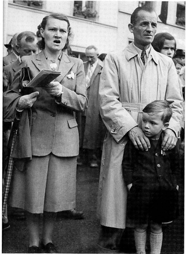
Singende Familie während des Festaktes.

Ungeachtet dieser Aktionen darf nicht übersehen werden, dass das Jubiläum vor allem einem Zweck dienen sollte, der von Beginn an klar definiert war: «einzigartige Gelegenheit für unsere Propaganda und die Pflege der public relations.» 17 Die verantwortliche Einbindung der Propaganda-Zentrale in die Gesamtorganisation des Jubiläums, ihre Aufgaben und auch die Zielsetzungen, vor allem für die interne Kommunikation, sind wesentlich komplexer als hier dargestellt. Zur Dokumentation dieses Events wird eigens ein Jubiläums-Archiv angelegt, das heute Bestandteil des Konzernarchivs der Georg Fischer AG ist und noch auf eine grundlegende Auswertung wartet.