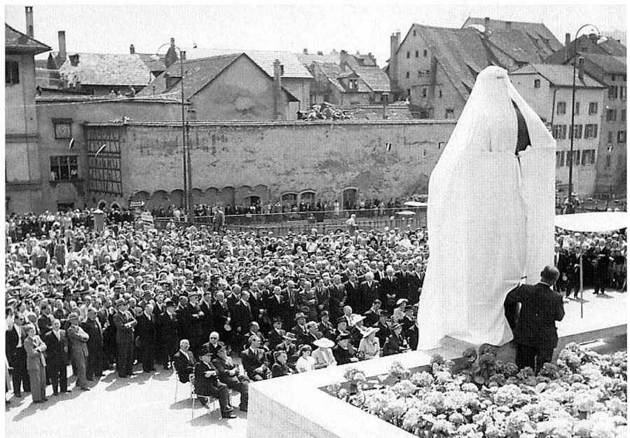
Enthüllung des Denkmals.

(Kegeln, Schach, Schiessen, Jassen) und Wettbewerbe (Foto, Film, Kurzgeschichte «Mein schönstes Jubiläums-Ereignis»). Die Ergebnisse dieser Wettkämpfe und Wettbewerbe werden jeweils in den «GF-Mitteilungen» veröffentlicht. Zum ersten Mal wird ein «Famili­entag» im Unternehmen durchgeführt, bei dem die Familienangehörigen zu einer Werksbesichtigung eingeladen werden. Diese Gelegenheit nehmen in