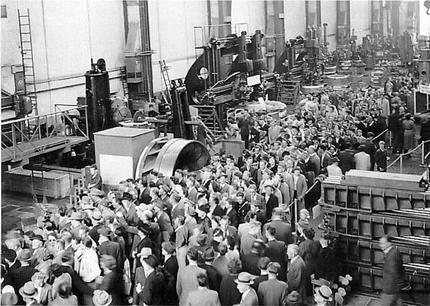
Famili­entag in den Bear­bei­tungs­werk­stät­ten.