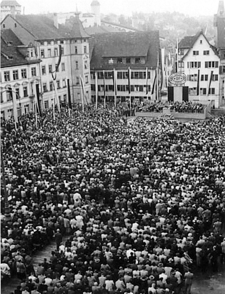
Festakt auf dem Herrenacker.

bei denen die ausländischen Vertreter nach Schaffhausen eingeladen werden. Ausnahme bilden hier die Fittings-Vertreter, für die mehrere Sonderveranstaltungen durchgeführt werden. Neben der Gratifikation für die Mitarbeiter werden verschiedene gemeinnützige Stiftungen und technische Einrichtungen, vor allem technische Hochschulen, mit Zuwendungen bedacht.