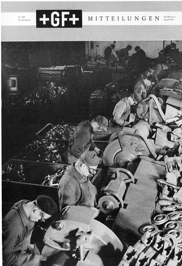
Drittes Layout ab 1959.