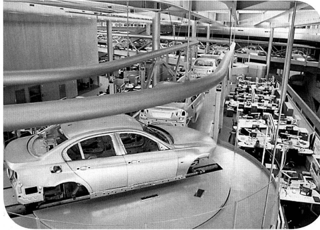
Förderstrecken im Zentralgebäude.

Associate Professor, Harvard Business School seit 2000, vorher in der Abteilung Geschichte an der Universität Pennsylvania. Promovierte 1993 an der Universität Stanford. Schwerpunkte der Forschung: Europäische Geschichte, Deutsche Geschichte, Unternehmensgeschichte sowie Organisations- und Managementtheorie. Unter anderem Autor von Organizing Control: August Thyssen and the Construction of German Corporate Management (Cambridge, Mass.: Harvard University Press, 2005).