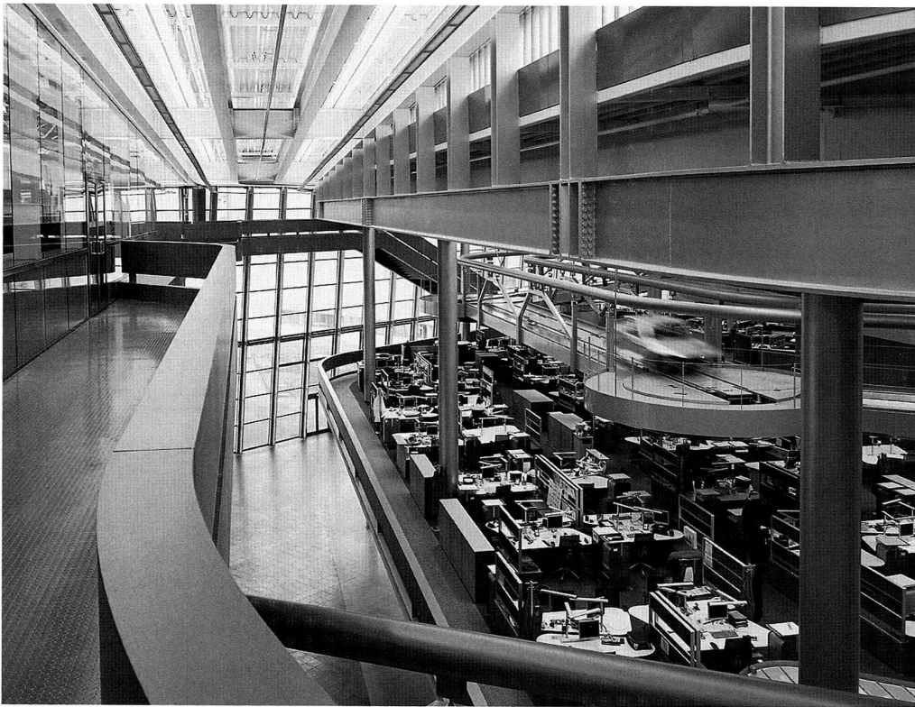
Kaskaden-Anordnung der Büroplattformen.

nik-Raum als «Instrument» in die Betriebsprozesse, das für alle Ingenieure, Techniker oder Facharbeiter aus dem Werk oder Zulieferer zur Verfügung steht. Sie können regelmässig darin zusammenkommen, um über Verfahren und Verbesserungen zu diskutieren. Wenn grössere Probleme auftreten, kommt eine «Springer»-Gruppe zum Einsatz, ein funktionsübergreifendes Expertenteam, das eine schnelle Problemlösung herbeiführt. Theoretisch zirkuliert die Informationsmenge zwischen den Mitarbeitern, während sie den Bürobereich hinauf- und hinuntergehen, in der informellen Atmosphäre des Restaurants, dem formalen Messtechnik-Raum, im Zentralgebäude – dies alles stellt einen «zentralen Anziehungspunkt» dar. Räumliche Nähe bedeutet Geschwindigkeit und Agilität bei der Problemlösung.