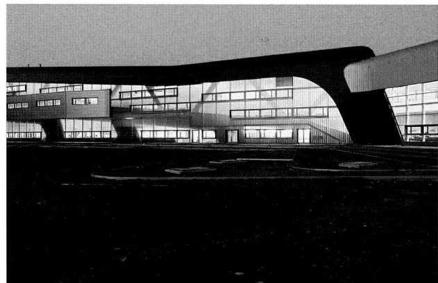
Aussenaufnahme des Zentralgebäudes am Abend.

Derartige Anhäufungen entwickeln sich, weil sich Unternehmen auf eine hohe Konzentration von Ressourcen (Risikokapital, staatliche Unterstützung), geistige und technische Fähigkeiten (Ausbildungszentren, Humankapital, Arbeitsbeziehungen) sowie direkte zwischenmenschliche Beziehungen (durch formale Networking-Organisationen, Partnerschaften oder informell in Kneipen und Restaurants) stützen, die den Wissenstransfer erleichtern. Dies hängt von einem stimulierenden, kommunikativen Umfeld ab, das auf