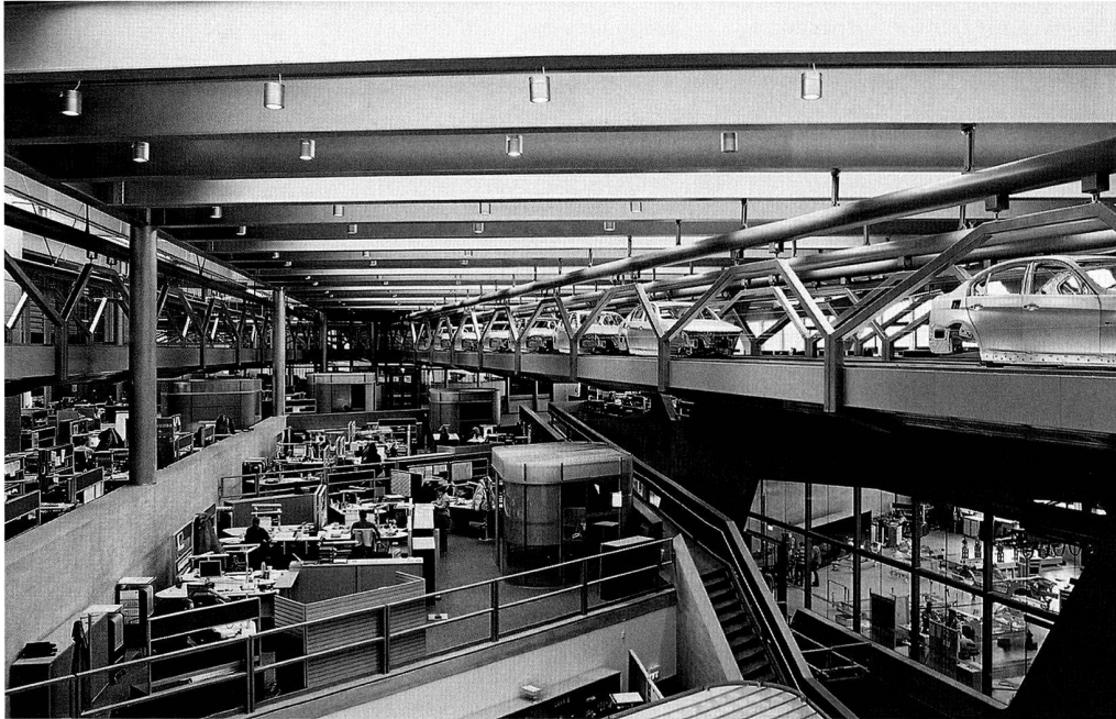
Blick ins Zentralgebäude.