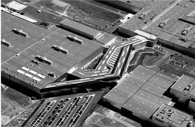
Luftaufnahme des Zentralgebäudes, 23. Juni 2005.