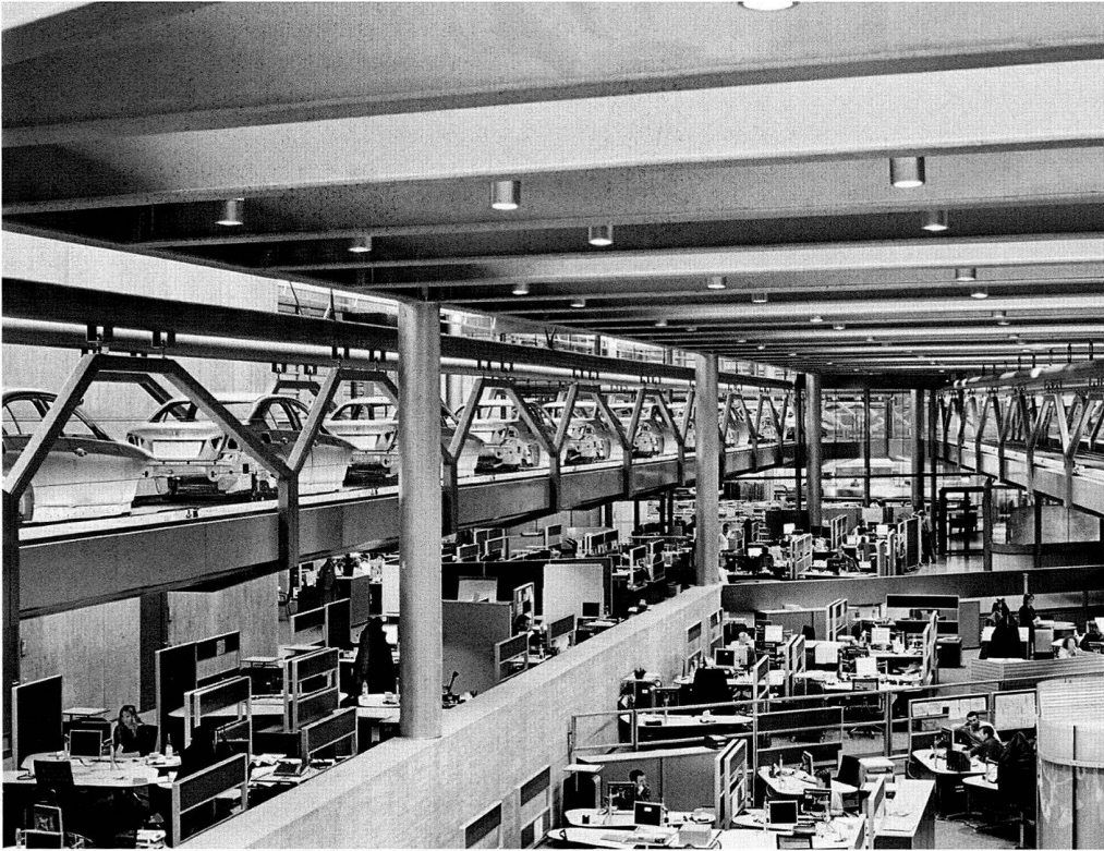
Offener Personenfluss zwischen den Ebenen.