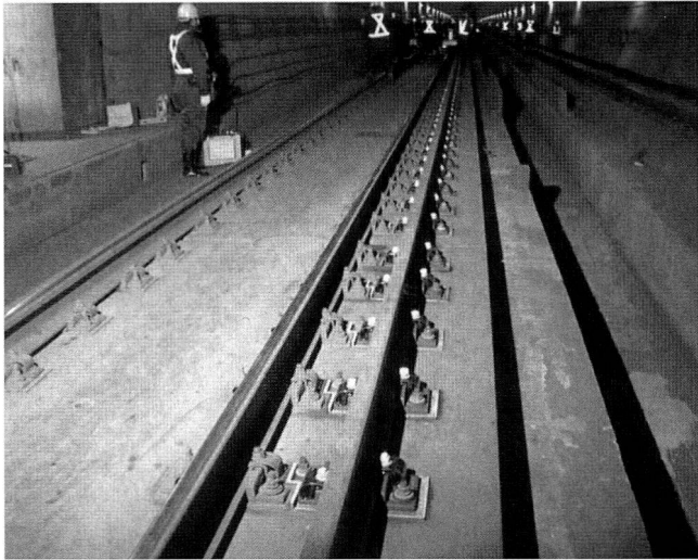
Bild 3: Die feste Fahrbahn im Tunnel für die beiden Spurweiten «Kap» und «Normal».

fahrplanmässig an den beiden Bahnhöfen, und geführte Besichtigungen der unterirdischen Räume werden unentgeltlich angeboten. In den grossen Auffangräumen befinden sich permanente Ausstellungen über Funktion und Bau des Tunnels. Damit sind die Anlagen ständig in Betrieb und durch Personal überwacht, welches dadurch sinnvoll beschäftigt ist und zugleich Reklame für das Bauwerk und die Sicherheit im Tunnel macht.