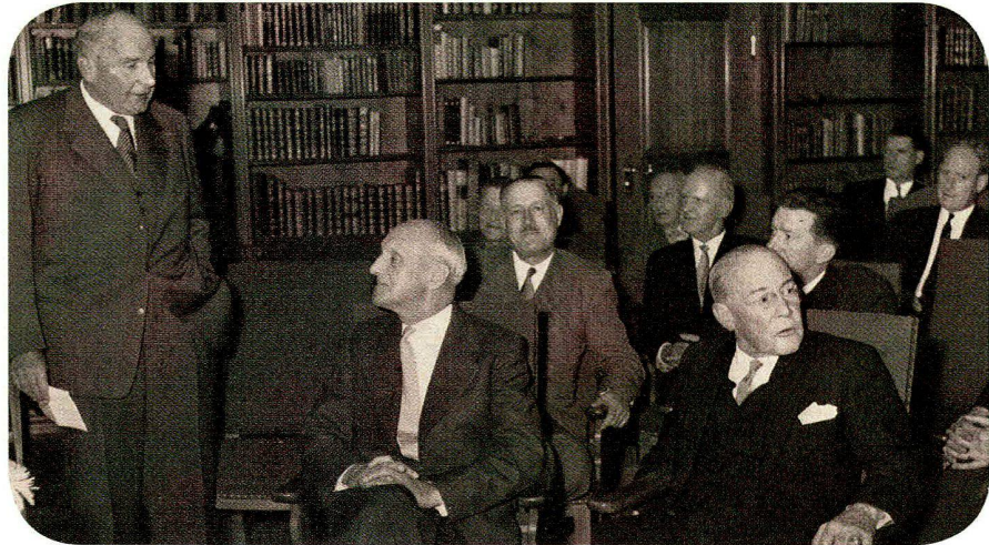
Bild 1: Erste Tagung der Eisenbibliothek 1958.

Studium der Mittelalterlichen und Sozial- und Wirtschaftsgeschichte an der Ruhr-Universität Bochum. 1999 bis 2003 Wissenschaftliche Mitarbeiterin des Hoesch-Archivs, Dortmund. Gleichzeitig postgradualer Studiengang zur Diplom-Archivarin an der FH Potsdam. Publikationen insbesondere zur Sozialgeschichte und zu archivfachlichen Themen. Promotion zum Thema «Vereinigung deutscher Wirtschaftsarchivare». Seit 2004 Leiterin des Konzernarchivs der Georg Fischer AG.