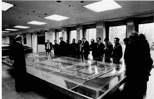
Bild 3: Besuch einer chinesischen Delegation im Werk Wolfsburg, 1978.

Company, Ltd.», kolportiert, im November 1978 habe der chinesische Maschinenbauminister Chou Tzu Tsian bei einem Besuch von Mercedes-Benz in Stuttgart so viele Volkswagen gesehen, dass er daraufhin nach Wolfsburg geeilt sei, um mit diesem Automobilhersteller unangemeldet in Gespräche einzutreten. 5