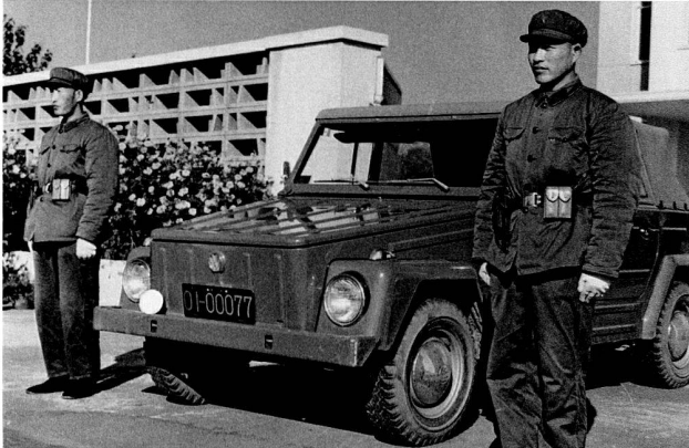
Bild 2: Der VW 181 Safari ex Mexiko in China, 1972.