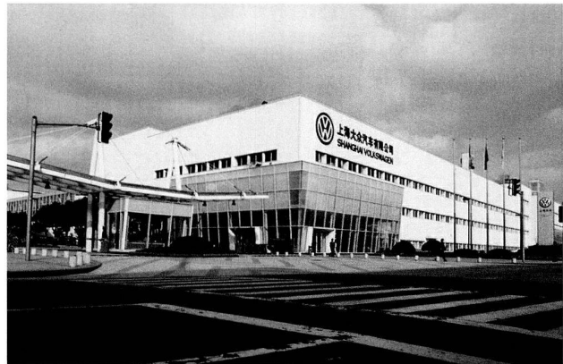
Bild 17: Shanghai-Volkswagen, 2007.

dem Santana die in Kooperation mit der Wolfsburger Entwicklung konzipierte China-Version mit verlängertem Radstand und veränderter Frontpartie hervor. Dem Santana 2000 folgte der Santana 3000. Das neue Modell wurde in Eigenregie von der SVW entwickelt, die 1997 den Grundstein für ein Entwicklungszentrum mit Testgelände gelegt hatte. Die Regionalisierung des Santana bildete den Auftakt zu einer eigenständigen Produktpalette für den chinesischen Markt, wo die seit 1982 gebaute Limousine bis heute zu den populärsten Fahrzeugen zählt. Als zweites Volumenmodell etablierte sich der Ende 2005 eingeführte Passat Lingyu. Für den marktgerechten Zuschnitt zeichnete auch das 2003 gegründete Design Center verantwortlich, dessen Mitarbeiterstab bis 2006 auf 35 chinesische Designer anwuchs. Damit erlangte die SVW die Kompetenzen für autonome Modellanpassungen, die den Kern der künftigen Produktstrategie bilden. Als erstes komplett selbst entwickeltes und designtes Modell ging 2008 die Stufenhecklimousine Laida an den Start. Regionalisierung war die eine, Vielfalt die andere Seite der Modellpolitik in China. Ende 1999 rollte bei der SVW der Passat vom Band.