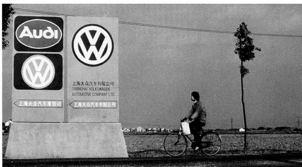
Bild 11: Etablierung des deutschen Mehrmarkenkonzerns in Shanghai, 1985.