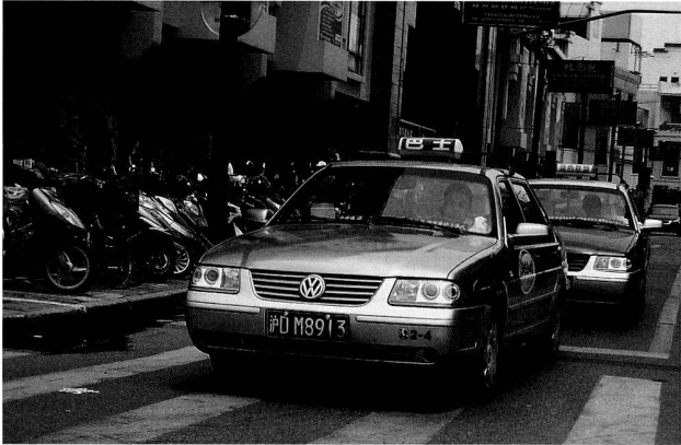
Bild 14: Santana 2000 als Taxi in Shanghai.