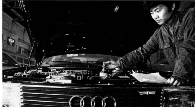
Bild 12: Montage des Audi 100 in Changchun, 1990.