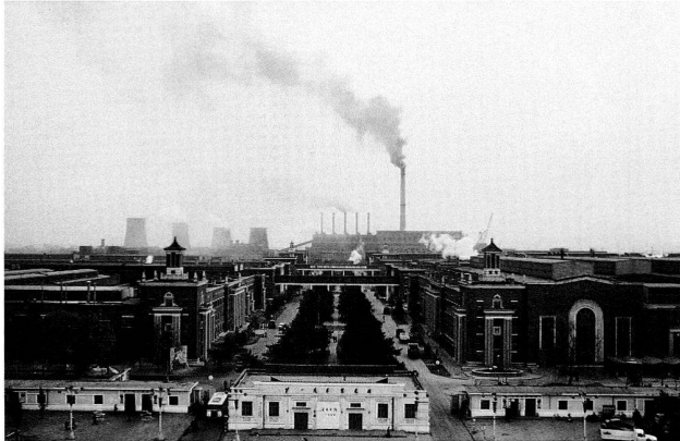
Bild 10: Die First Automobile Works in Changchun, 1990.