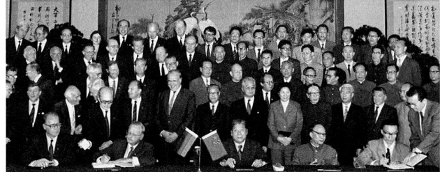
Bild 8: Unterzeichnung des Joint-Venture-Vertrages in Anwesenheit von Bundeskanzler Helmut Kohl.

Das dynamische Wachstum der chinesischen Wirtschaft, aber auch die Geschäftsreisenden und der boomende Tourismus liessen den Pkw-Inlandsbedarf ansteigen, sodass Volkswagen vier Jahre nach dem Bandablauf des ersten Santana in Shanghai im Oktober 1987 in Sondierungsgespräche mit der First Automobile Works (FAW) in Changchun eintrat. Das im August 1988 unterzeichnete «Memorandum of Understanding» schuf die Grundlage für die folgenden Verhandlungen über die Errichtung eines Produktionsbetriebs mit Press-, Motoren- und Getriebewerk. 53 Im ersten Schritt sollte bei der FAW die Lizenzfertigung des Audi 100 mit einem Jahres-