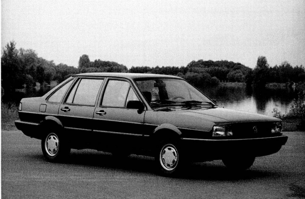
Bild 4: Kooperationsgegenstand Santana, 1986.