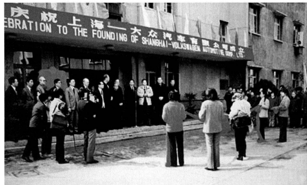
Bild 9: Gründungszeremonie der «Shanghai-Volkswagen Automotive Company, Ltd.», 1985.

volumen von 30 000 Fahrzeugen erfolgen. Ab 1991 waren die Gründung eines Gemeinschaftsunternehmens und ein Fabrikneubau mit einer Jahreskapazität von 150 000 Fahrzeugen vorgesehen, um ein Modell der Golf- oder der Passat-Klasse zu produzieren. Der Konzernvorstand stimmte zu und hatte dafür gute Gründe: Mit der Errichtung eines zweiten Produktionsstandorts wollte Volkswagen seine Pionierstellung in China in eine langfristige Marktdominanz überführen. Darüber hinaus ermöglichte die Verwendung gleicher Bauteile für die in Shanghai und Changchun gefertigten Fahrzeuge eine Senkung der Produktionskosten. Und nicht zuletzt war die projektierte Fabrik als Exportbasis für die Belieferung des asiatisch-pazifischen Raums von hoher Bedeutung. Vor allem in diesem Punkt deckten sich die Interessen beider Seiten insoweit, als auch die chinesische Seite ein möglichst hohes Exportvolumen zum Devisenausgleich anstrebte. Die Gründung der «FAW-Volkswagen Automotive Company, Ltd.» (FAW-Volkswagen), an der die Volkswagen AG 40 Prozent übernahm, erfolgte am 6. Februar 1991. 54 Im Dezember 1991 rollten bei der FAW-Volkswagen die ersten aus importierten Teilesätzen montierten Jetta vom Band. Der Übergang von der Montage zur Produktion erfolgte im September 1995,