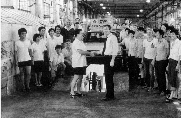
Bild 6: Das deutsch-chinesische Projektteam mit dem ersten Erfolgserlebnis, 1983.