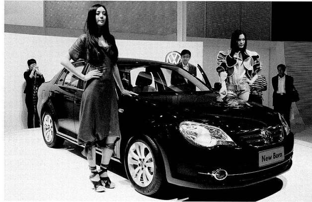
Bild 19: Präsentation des New Jetta der FAW-Volkswagen, 2008.

2000 nach Thailand und ab 2002 auf die Philippinen verschifft. Der Export des Polo nach Australien begann im November 2003. Damit wurde verspätet ein Kalkül der chinesischen Seite Realität: Volkswagen exportiert von China in den Pazifikraum. An der Kooperation mit chinesischen Partnern führt für das Automobilunternehmen Volkswagen kein Weg vorbei. Die chinesischen Partner bleiben ihrerseits an der Fortsetzung der gedeihlichen Zusammenarbeit interessiert, weshalb der Joint-Venture-Vertrag des SVW inzwischen verlängert wurde.