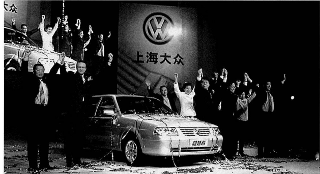
Bild 16: Präsentation des Santana 3000, 2004.