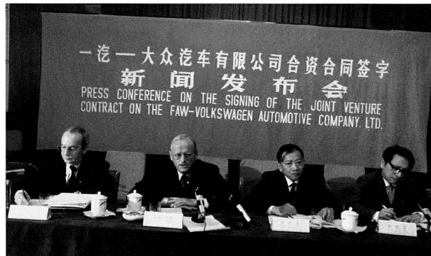
Bild 13: Pressekonferenz anlässlich der Unterzeichnung des Joint-Venture-Vertrages mit der FAW, 1991.

als das Presswerk und die Lackiererei offiziell eröffnet wurden. Den Abschluss der ersten Ausbaustufe bildete 1996 die Inbetriebnahme der Produktionsstätte für Getriebe und Motoren, die sowohl die Volkswagen-Standorte in China als ab Anfang auch den Konzernverbund mit Rumpfmotoren belieferte.