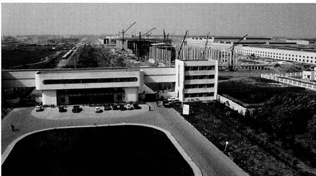
Bild 15: Neu- und Erweiterungsbauten in Changchun, 2004.