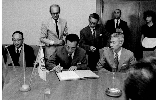
Bild 5: Unterzeichnung des Probemontagevertrags, 1982.

Die Verhandlungsdelegation unter Leitung von Wolfram Nadebusch machte darüber hinaus einen Marktschutz für Pkw und leichte Nutzfahrzeuge bis 2,6 Liter Hubraum durch einen Ausschluss weiterer Produktionslizenzen für einen zu