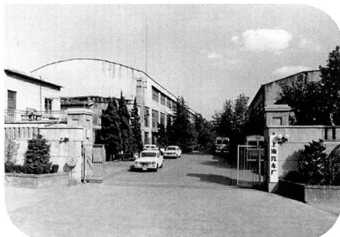
Bild 1: Fabrik der Shanghai Tractor and Automobile Corporation, 1982.

Geboren 1960. Studium der Geschichte, der Osteuropäischen Geschichte sowie der Publizistik und der Kommunikationswissenschaften an der Ruhr-Universität Bochum; 1998 Eintritt in die Volkswagen Aktiengesellschaft, derzeit Leiter der Historischen Kommunikation. Lehrbeauftragter am Institut für Wirtschafts- und Sozialgeschichte der Georg-August-Universität Göttingen. Zahlreiche Veröffentlichungen u.a. zur Unternehmensgeschichte von Volkswagen.