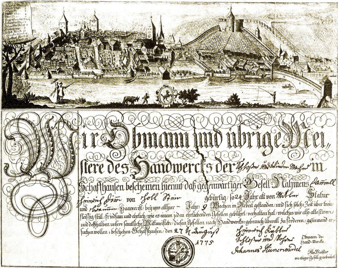
Kundschaft eines Schlossergesellen aus Schaffhausen 1775.

(Quelle: Klaus Stopp: Handwerkskundschaften der Schweiz. Arbeitsattestate wandernder Gesellen. Weissenhorn 1979, S. 41)