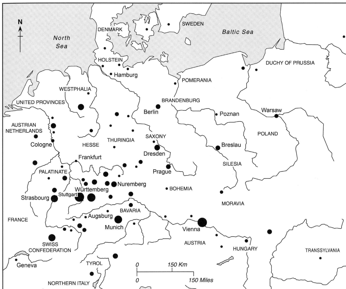
Herkunftsorte fremder Goldschmiedegesellen in Augsburg [1774 – 75, 1770, 1787 – 98].