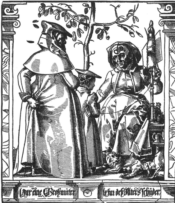
In den Darstellungen der «Lebensalter des Menschen» erscheint die Brille als unvermeidbares Attribut des Alters: Ein Holzschnitt nach Zeichnungen von Tobias Stimmer (1539 in Schaffhausen geboren) zu den zehn Altersstufen zeigt die 60-Jährige am Spinnrocken mit Mützen-Brille.

(Quelle: Max Bendel: Tobias Stimmer. Leben und Werke, Zürich u. Berlin 1940, S. 107)