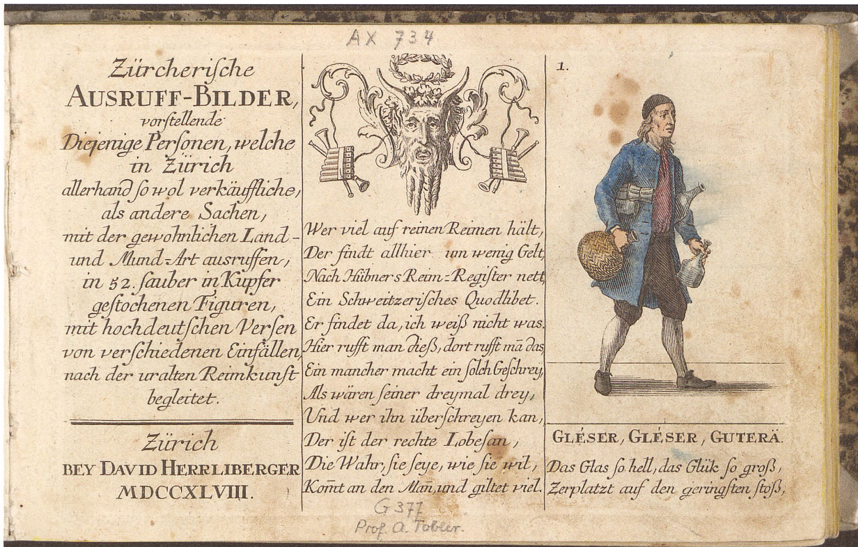
Titelblatt der «Zürcherische Ausruff-Bilder» von David Herrliberger (Zürich 1748).

(Quelle: David Herrliberger: Zürcherische Ausruff-Bilder vorstellende Diejenige Personen [...]. Zürich 1748–1751. Zentralbibliothek Zürich, Graphische Sammlung)