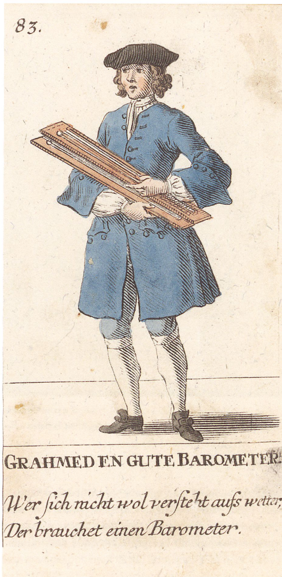
Ausrufer von David Herrliberger (Zürich 1748).

(Quelle: David Herrliberger: Zürcherische Ausruff-Bilder vorstellende Diejenige Personen [...]. Zürich 1748–1751. Zentralbibliothek Zürich, Graphische Sammlung)