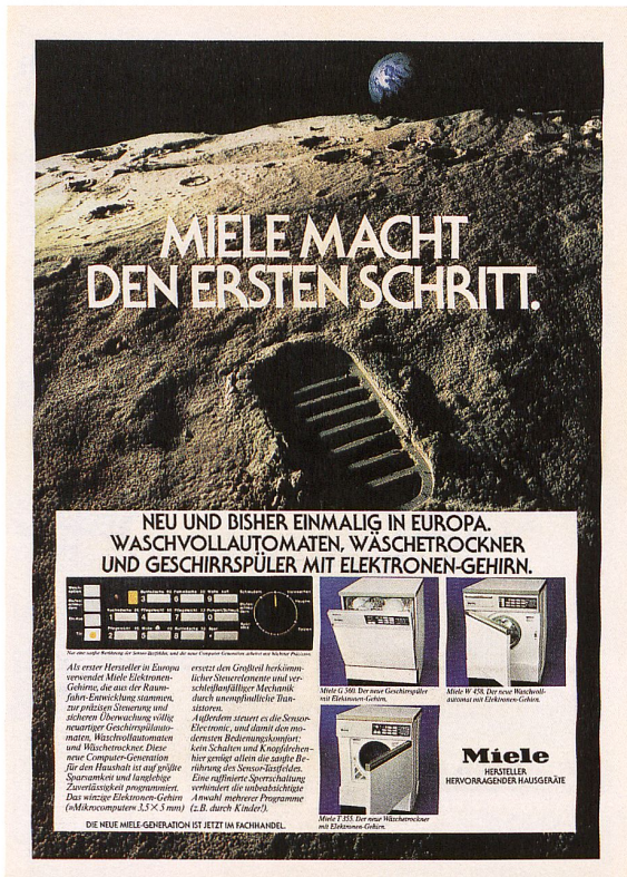
Anzeige von Miele 1978.