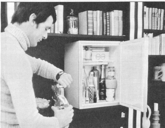
Vergleichender Produkttest Absorberkühlschränke. Stiftung Waren-test: Lautlose Stromfresser.

(Quelle: test. Die Zeitschrift für den Verbraucher, 12 [1977])