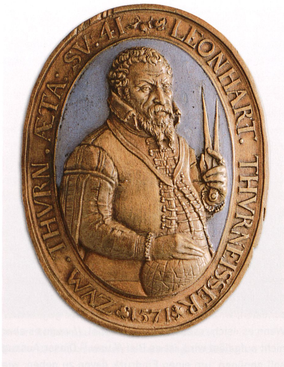
Porträt des Leonhard Thurneysser von Basel, Relief aus Birnbaumholz, 1571.

(Quelle: Historisches Museum Basel, Inv. 1911.61, Foto: P. Portner)