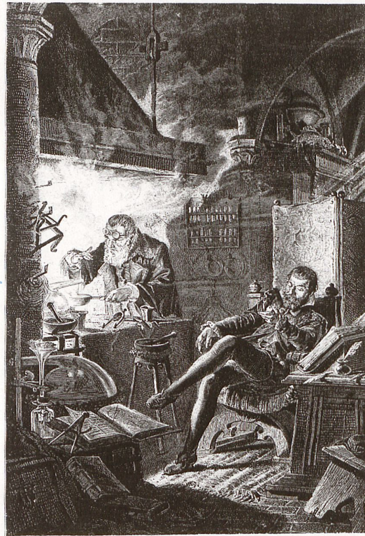
Der Alchimist Leonhard Thurneysser und Kurfürst Johann Georg von Brandenburg im Labor. Holzschnitt, 19. Jahrhundert.

(Quelle: Historisches Museum Basel, Inv. 1911.61,)