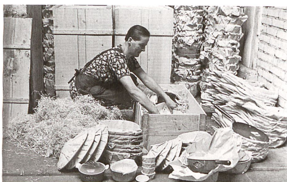
In einer Verkaufsbroschüre von 1940 wird der aufwendige Herstellungsprozess beschrieben und illustriert: Guss, Emaillierung und Verpackung von Kochtöpfen.