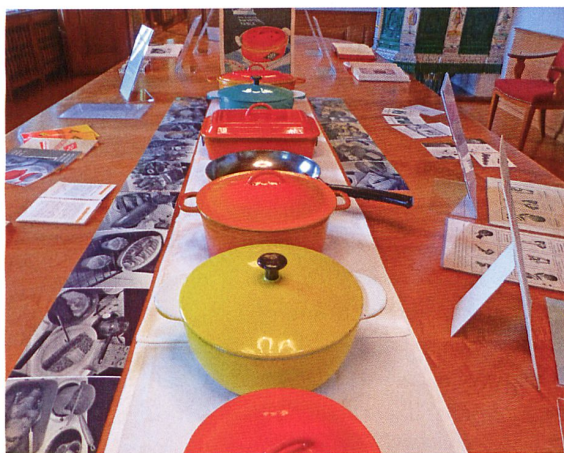
Das farbenfrohe GF-Kochgeschirr in der Eisenbibliothek.

The enameled cast iron pans that GF produced between 1933 and 1968 are still very popular among devotees of good cuisine. How did an industrial company that was famous for its fittings, truck wheels, castings and machine tools get involved in producing something so completely different as pots and pans? This is the colorful story of GF cooking utensils, based on the memoirs of GF's former traveling salesman for commercial cast iron products, along with the economic and political background that was ultimately responsible for the launch and success of this product range.