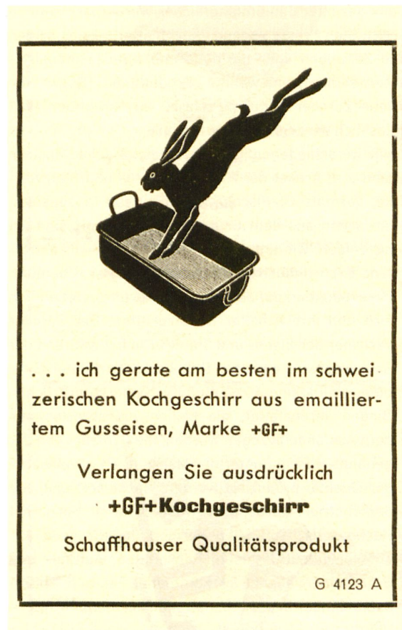
Werbecliché von 1934.

sent, und ein Jahr später beteiligte er sich am ersten schweizerischen Ausstellungszug, der zwischen Juni und Oktober 1935 mit 16 ausrangierten SBB-Wagen als fahrende Ausstellung an allen grösseren Bahnhöfen der Schweiz haltmachte: «Der Besuch war überall sehr stark, denn die Schulen wurden zum Besuche aufgeboten», aber auch das Publikumsinteresse war hoch, trotz dem stattlichen Eintrittspreis von einem Franken pro Person. 14 Alle diese Bemühungen zeigten Wirkung, und bald waren die Bestellungen grösser als die Lagerbestände.