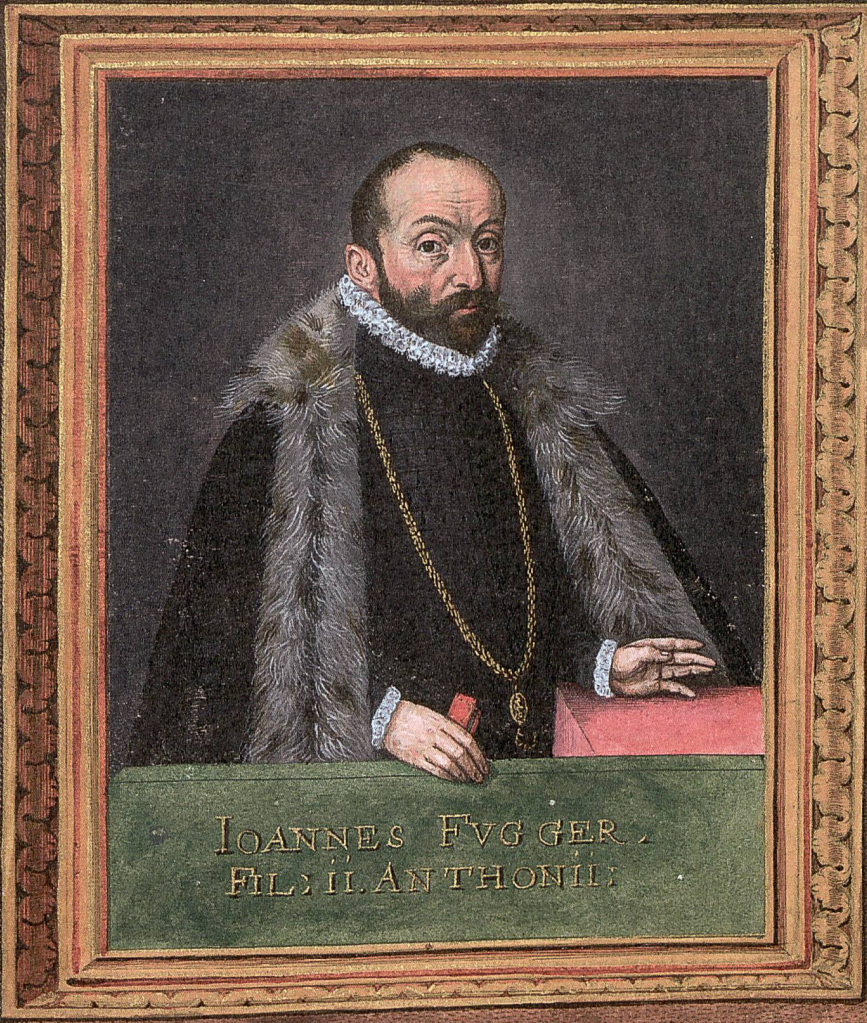
IOANNES FUGGER, FIL: II. ANTHONII