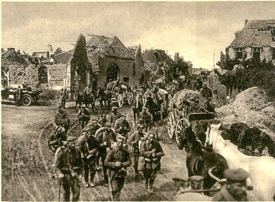
Deutsche Kolonnen im Vormarsch durch die Straßen von Bapaume, das von 1914 bis zum freiwilligen Rückzug im März 1917 in deutschem Besitz war und im März 1918 von der 17. Armee wiedergewonnen wurde.

1 Vormarsch in einer späten Kriegsphase.