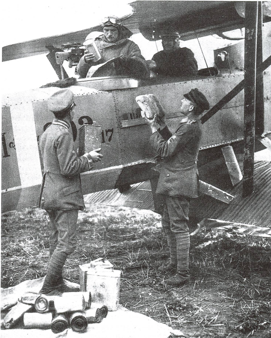
6 Ein Schlachtflugzeug wird mit Versorgungsgütern beladen (1918).