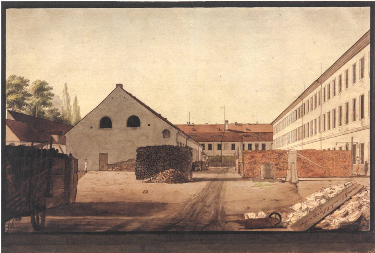
1 Die KPM, Zeichnung von Eduard Gaertner, 1818.

Im Folgenden gebe ich zuerst einen Überblick über die Organisation der Königlich Preussischen Porzellanmanufaktur (KPM) sowie die Rolle besonderer Experten – der Arcanisten und Laboranten –, deren spezielles Wissen weichenstellend für den gesamten Produktionsprozess war. An einem konkreten Beispiel wird dann die Einführung einer neuen, wissenschaftlich-technischen Ausbildung dieser Experten im letzten Drittel des 18. Jahrhunderts beleuchtet. 5 Daran anschließend gehe ich auf den Diskurs über nützliche Wissenschaften ein.