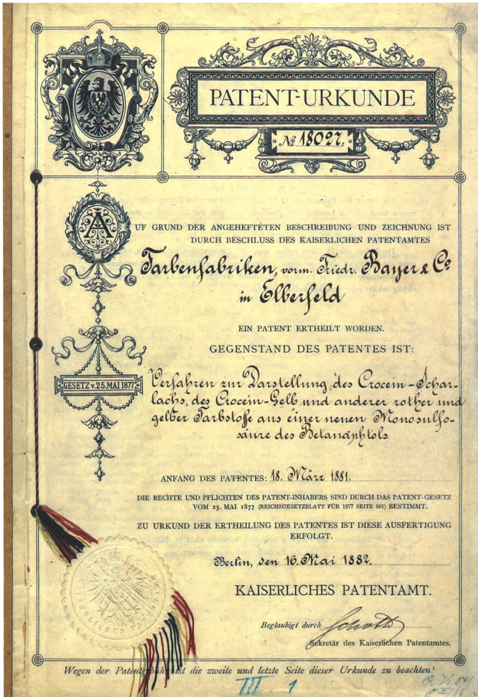
1 Das erste Zeugnis eigener Grundlagenforschung: Patenturkunde Croceinscharlach von 1882.

industrielle Umsetzung, da die Synthese grosse Mengen der sehr teuren Chemikalie Brom benötigte. Bei der technischen Überführung kam der BASF eine besondere Bedeutung zu, da es dem dort angestellten Chemiker Heinrich Caro gelang, den Farbstoff auf einem wirtschaftlichen Weg industriell herzustellen. 10 Wie im Falle der Anilinfarben fand die Zusammensetzung des synthetischen Alizarins den Weg an die Öffentlichkeit, weshalb Konkurrenzunternehmen – unter ihnen auch Bayer – die Produktion zu Beginn der 1870er-Jahre aufnahmen und teilweise effizienter produzierten als BASF selbst. Trotz dieser kurzfristigen wirtschaftlichen Unterlegenheit zog BASF langfristige strategische Vorteile aus der Synthese des Alizarins. Die Kooperation mit Hochschulen führte nicht nur zu einem Wissenstransfer zwischen den beiden Organisationen, sondern