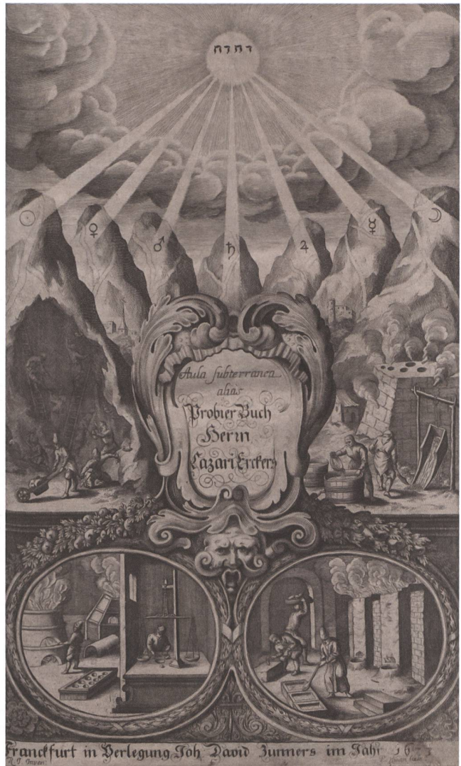
2 Frontispiz, Lazarus Ercker, Aula subterranea domina dominantium subdita subditorum, Frankfurt: P. Humm, 1673. Folioformat.

Die Hervorhebung von Saturn und des ihm zugeordneten schweren, leicht schmelz- und formbaren Metalls ist nicht ausschliesslich auf dessen Bedeutung im Saigerprozess