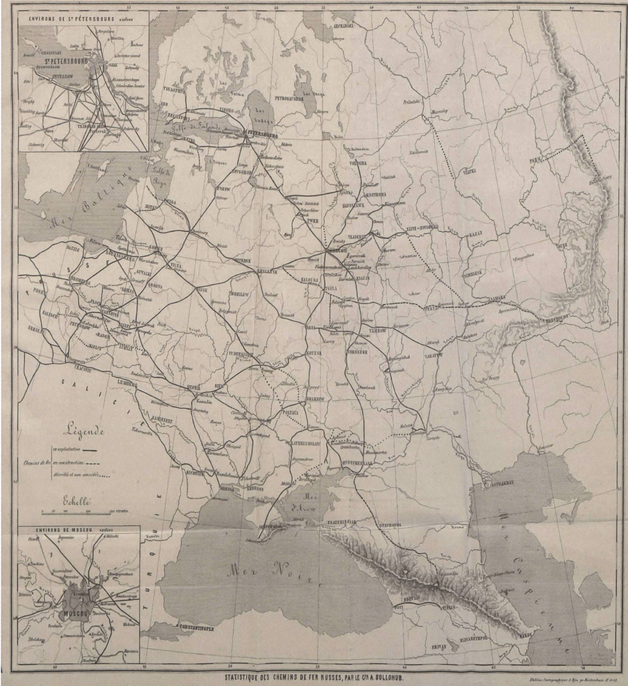
1 Karte der russländischen Eisenbahnen um 1871.