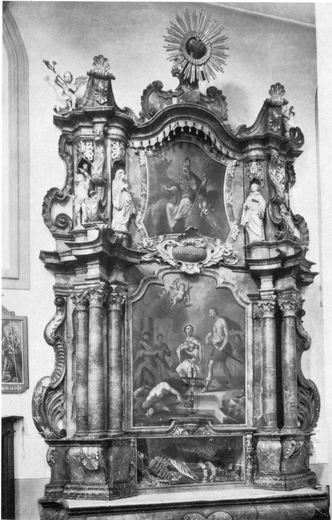
Schmiedezunftaltar der Augustinerkirche St. Moritz in Freiburg