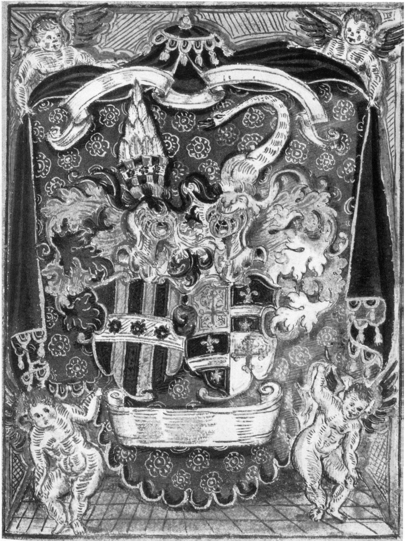
Wappen der Familien v. Estavayer und Wallier, am Anfang des Manuskripts