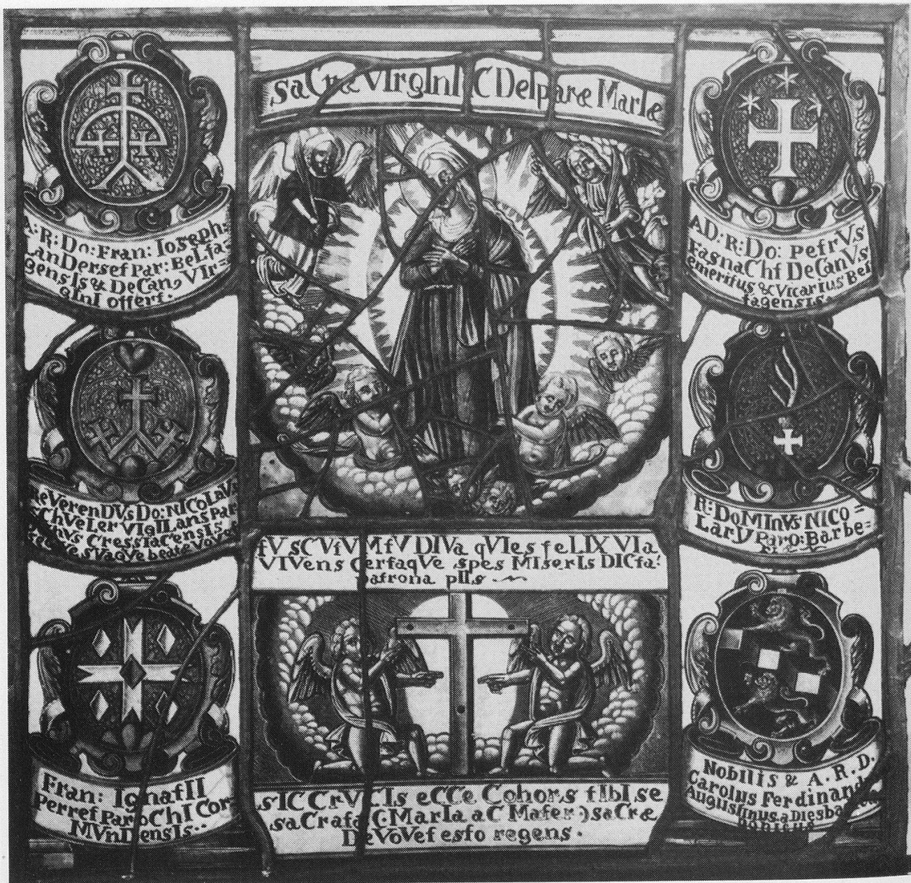
Abb. 5: Scheibe des Dekanats Heiligkreuz des Bistums Lausanne von 1710 für die Marienkapelle Dürrenberg, heute MKGF, Inv.-Nr. 3424 (Foto MKGF, 1985).