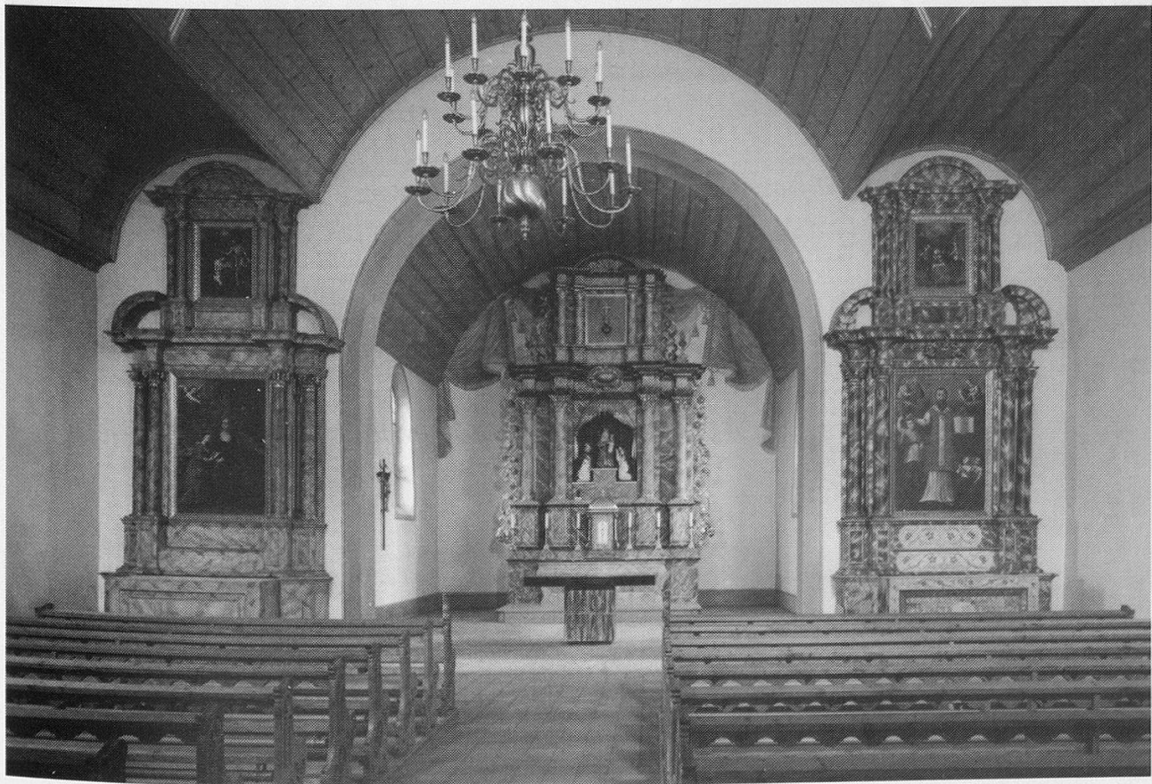
Abb. 2: Dürrenberg, Marienkapelle, Inneres nach der Restaurierung der 1980er Jahre (Inventar der Kunstdenkmäler, Foto Yves Eigenmann, 1992).