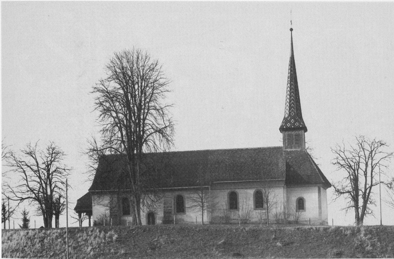
Abb. 1: Gurmels, Dürrenberg, Marienkapelle, Ansicht von Südosten (Inventar der Kunstdenkmäler, Foto Jacques Thévoz, 1978).