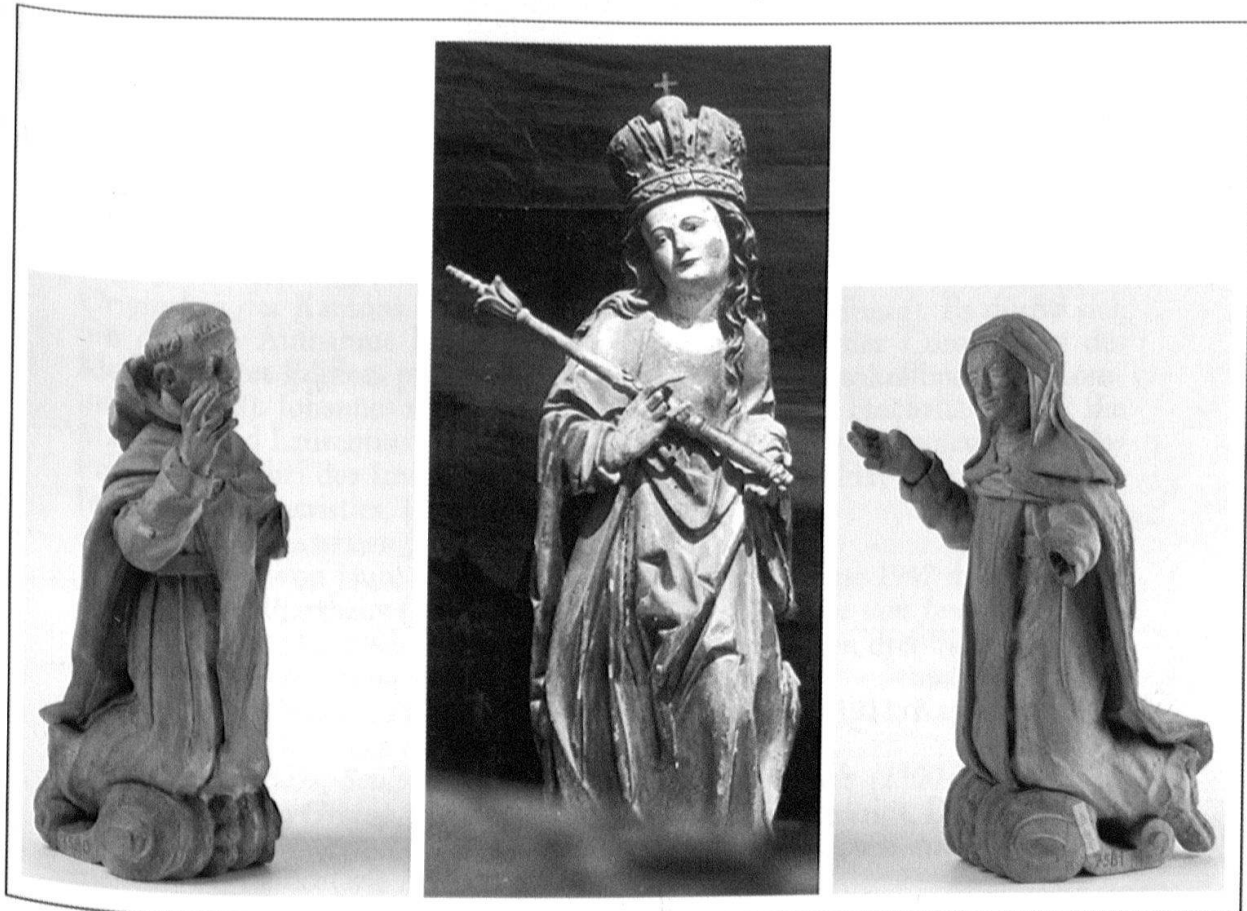
Abb. 9: Rosenkranzretabel, Mitte 17. Jh., Rekonstruktionsversuch (Madonna mit barocken Veränderungen im Zustand um 1930, Begleitfiguren im aktuellen Zustand) (Foto Primula Bosshard).