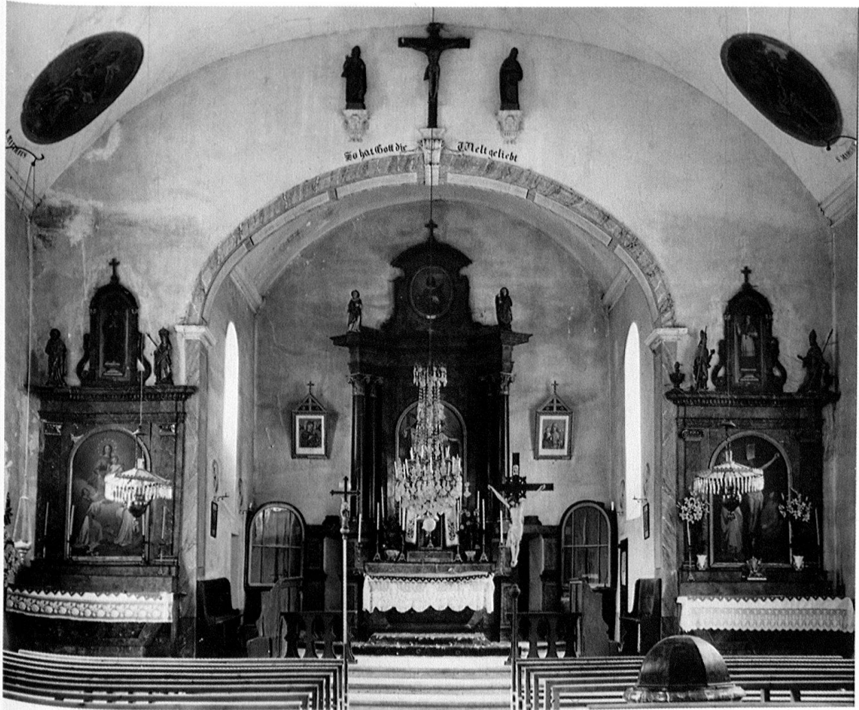
Abb. 3: Jaun, Alte Pfarrkirche (Zustand um 1906) (Kantons- und Universitätsbibliothek Freiburg).