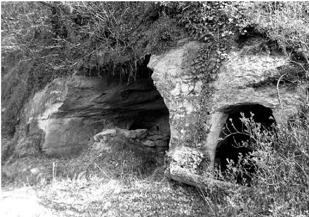
Abb. 6: Die Überreste der vorderen Einsiedelei unter dem Palatinat, aus dem 18.–19. Jahrhundert.

Vor den Toren des alten Freiburg – so lesen wir es in ungezählten Reisebeschreibungen – herrschte die wilde, ungezähmte Natur. Sie zog mindestens seit dem 17. Jahrhundert auch Einsiedler an, die zwar der geschäftigen Stadt entflohen, gleichzeitig aber auch auf nicht allzu seltene Besucher angewiesen waren, die ihren materiellen Unterhalt gewährleisten halfen. Auch die Stadtklöster scheinen manchmal diese Rolle übernommen zu haben.