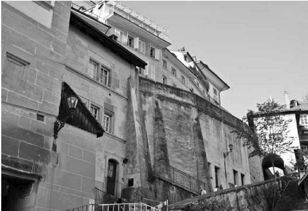
Abb. 8: Von den drei unter der Alten Brunnengasse errichteten Wohnhäusern am Kurzweg besteht noch das unterste Haus.