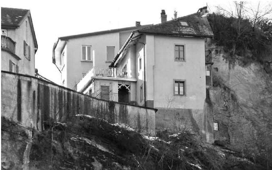
Abb. 7: Die Fluhhäuser am Weg nach Loreto (Obere Matte 46–48).