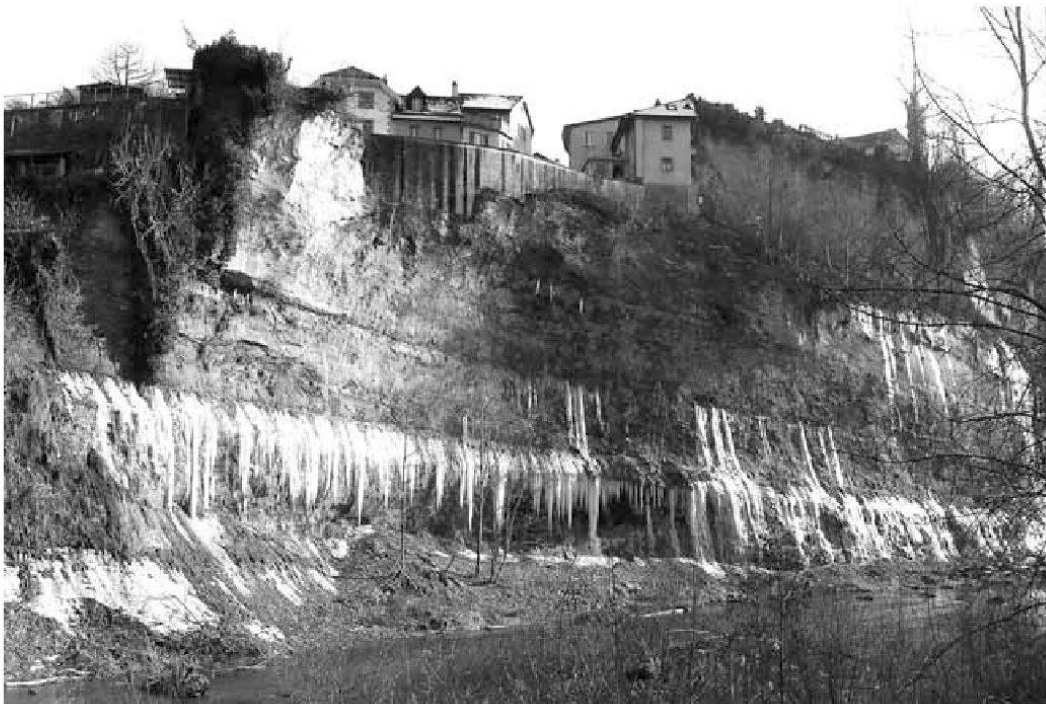
Abb. 5: Die Eisvorhänge entlang der Mergelschichten unter der Sonnenberg-Fluh.

Will man dieses Grundwasser in wirtschaftlich verwertbaren Mengen anzapfen, kommt man nicht um das Graben waagrecht Stollen von unterschiedlicher Tiefe herum. Solche im Durchschnitt einen halben Meter breiten und anderthalb Meter hohen Tunnels existieren zuhauf, wenn sie auch heute meist an ihrem Ausgang vermauert sind, so zum Beispiel am Plätzli der Altbrunnengasse unterhalb der Alpenstrasse, in der Motta unterhalb der Neustadtgasse oder auch am bergseitigen Ende der Oberen Matte. Nach einer Statistik der Wasserversorgung von 1878 26 gab es auf Stadtgebiet 10 Hauptquellen, die vor allem die 29 öffentlichen Brunnen speisten, aber auch 44 private Wasserkonzessionen. Diese Quellfassungen waren nicht immer leicht zugänglich, wie die klostereigene Quelle der Fran-