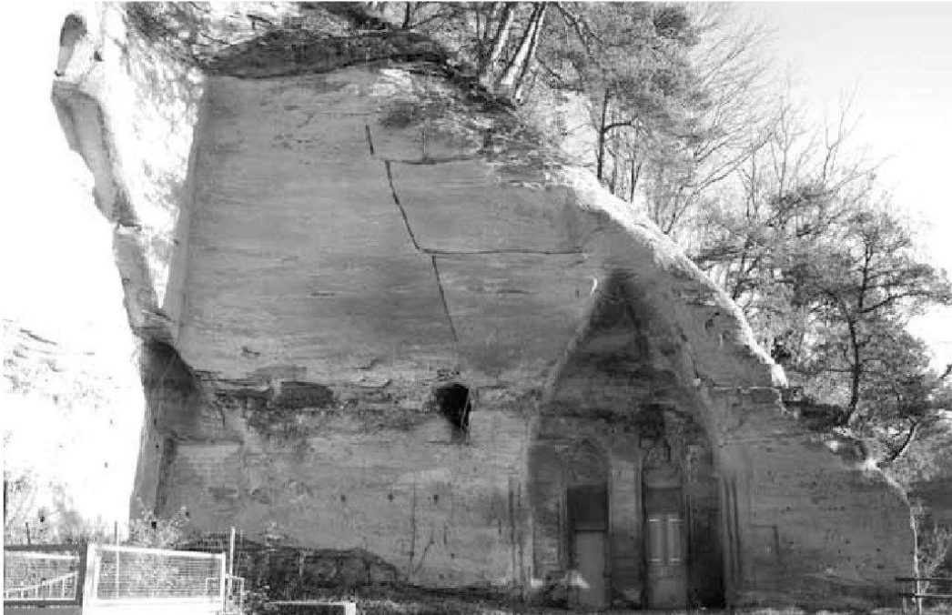
Abb. 10: Brückenkopf der alten Galtern-Hängebrücke von 1840, deren Drahtseile im Fels (oben links) verankert waren. Spitzbogennischen mit dem Lokal des ehemaligen Polizeipostens, heute ungenutzt.