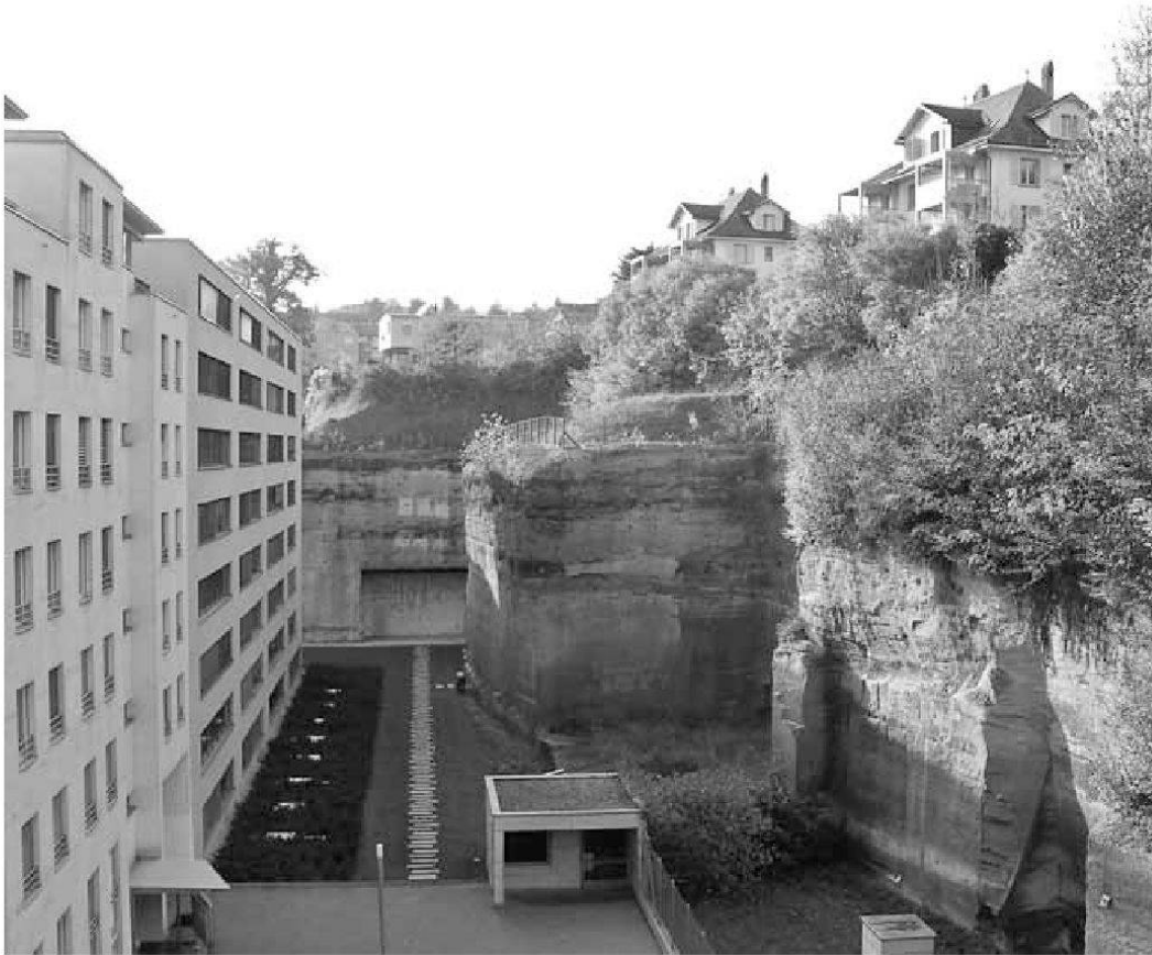
Abb. 4: Beauregard, der bekannteste der städtischen Steinbrüche, der schon das Bau-material für die Kirche St. Nikolaus geliefert haben soll.

steinbruch (wie sich ja auch der ursprünglich französische Begriff Molasse etymologisch von mola , «Mühlstein», herleiten soll). Auf der ältesten Stadtansicht von Hans Schüffelin von 1543 22 kann man an dieser Stelle eine Abbauvorrichtung erkennen. Kleinere private Steinbrüche, wie zum Beispiel an der Oberen Matte, liessen manchmal einen seitlichen Rand als natürliche Gartenmauer stehen.