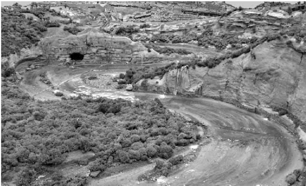
Abb. 1: Saane-Mäander bei der Magerau, nach dem «Frima»-Modell (Martiniplan 1606).

Eindeutiger scheint ein Blick auf die Landschaft der unmittelbaren Umgebung. Das dreidimensionale Stadtmodell «Frima» (Abb. 1) orientiert sich am Martiniplan von 1606 und vermittelt einen einigermaßen glaubwürdigen Eindruck 11 . Ein Hauptunterschied zum heutigen Zustand besteht dabei im damals noch ungebändigten Saanelauf in der Tiefe des Cañons. Das breite, im eigentlichen Wortsinn «ausufernde» Flussbett bot noch kaum Möglichkeiten für landwirtschaftliche, geschweige denn gewerbliche Nutzung. Deshalb ist die Mühle im linksufrigen Auquartier, dge-