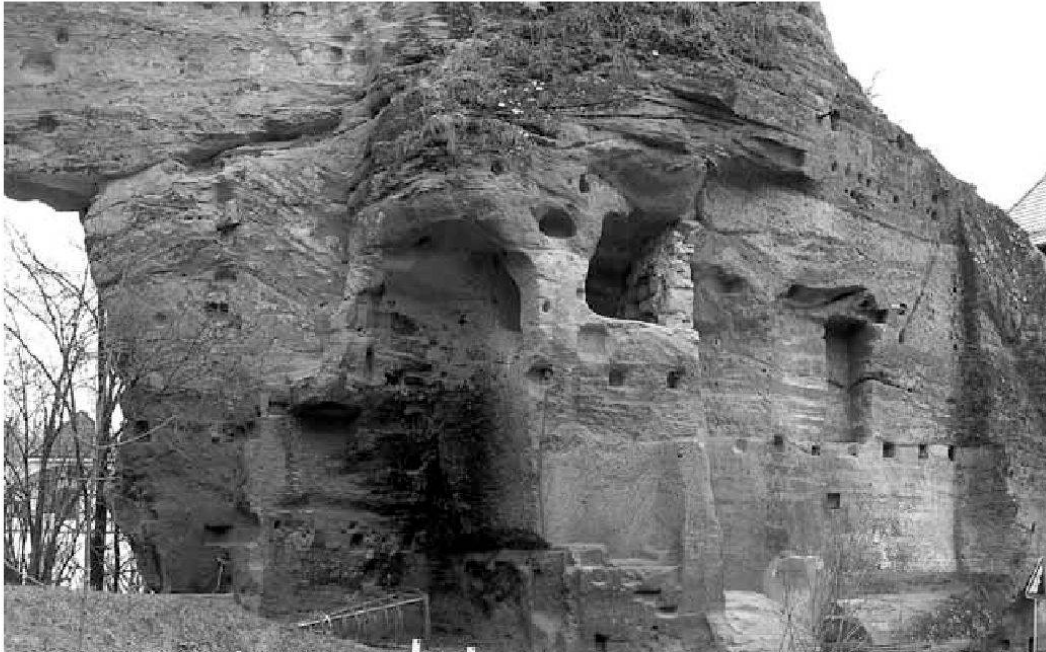
Abb. 9: Felsfassaden der ehemaligen Fluhhäuser an der Balmgasse, mit Balkenlöchern, Treppen und Kaminspuren.