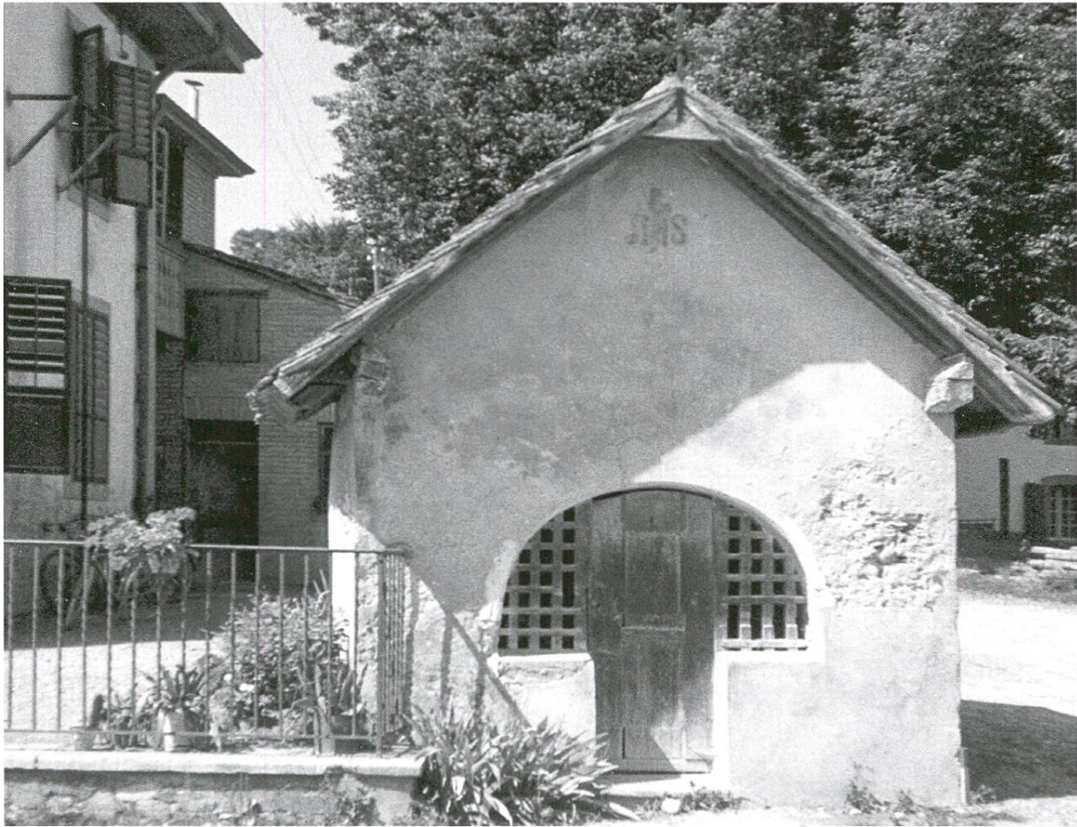
Fig. 3: L'ancienne chapelle de Notre-Dame des Sept Douleurs peu avant sa démolition en 1964.