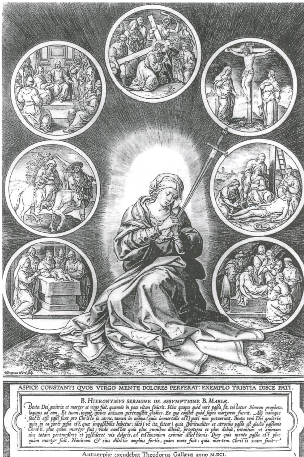
Fig. 10: Notre-Dame des Sept Douleurs. Gravure de Hieronymus Wierix, 1601. Reproduction tirée de Friedrich Wilhelm Heinrich HOLLSTEIN, Dutch and Flemish etchings, engravings and woodcuts: 1450–1700 , Rotterdam cop. 2003–2004, part. 4, p. 217, No 895.