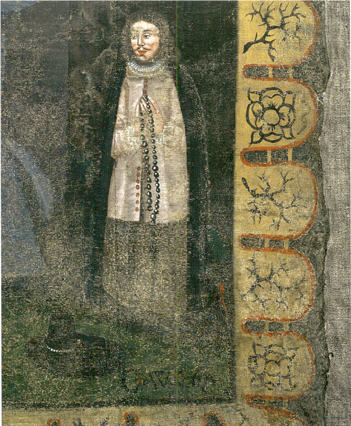
Fig. 9: Le fondateur du tableau de Notre-Dame des Sept Douleurs, François-Louis-Blaise d'Estavayer-Molondin (1639–1692), le chiffre du peintre suivi de la date d'exécution du tableau (détail).