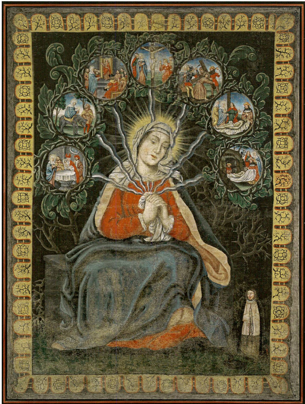
Fig. 4: Le tableau de Notre-Dame des Sept Douleurs.