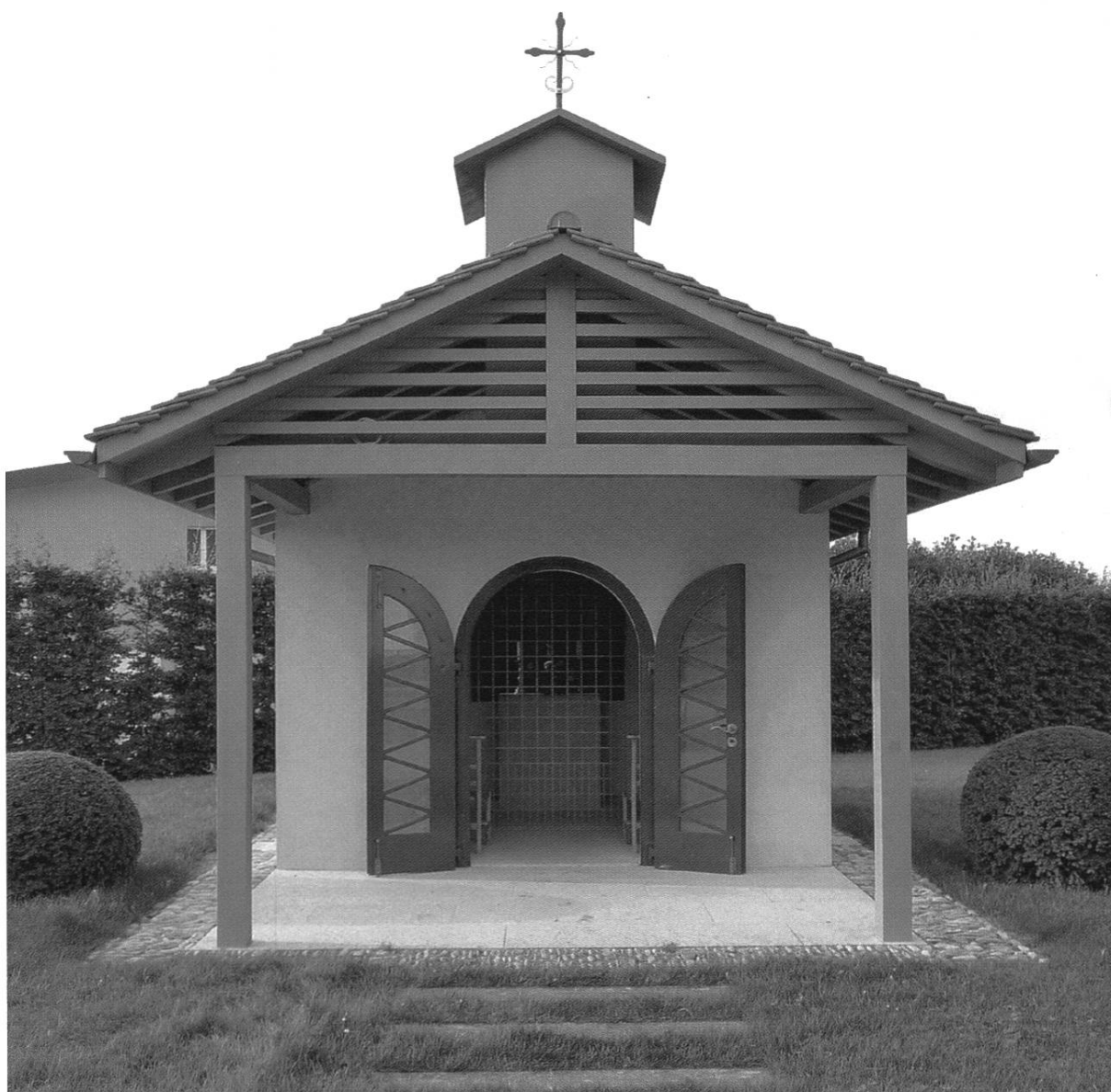
Fig. 1: La chapelle de Notre-Dame des Sept Douleurs dans le village de Barberêche, vue de l'extérieur en 2010.