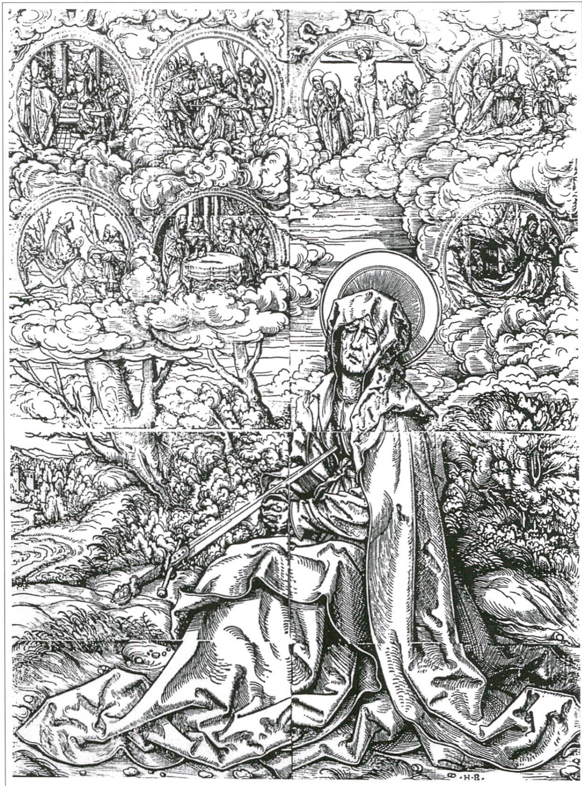
Fig. 5: Vierge des Sept Douleurs. Gravure de Hans Burgkmair l'Ancien, 1524. Reproduction tirée de Hans Burgkmair, Das Graphische Werk , Augsburg 1973, No 147.