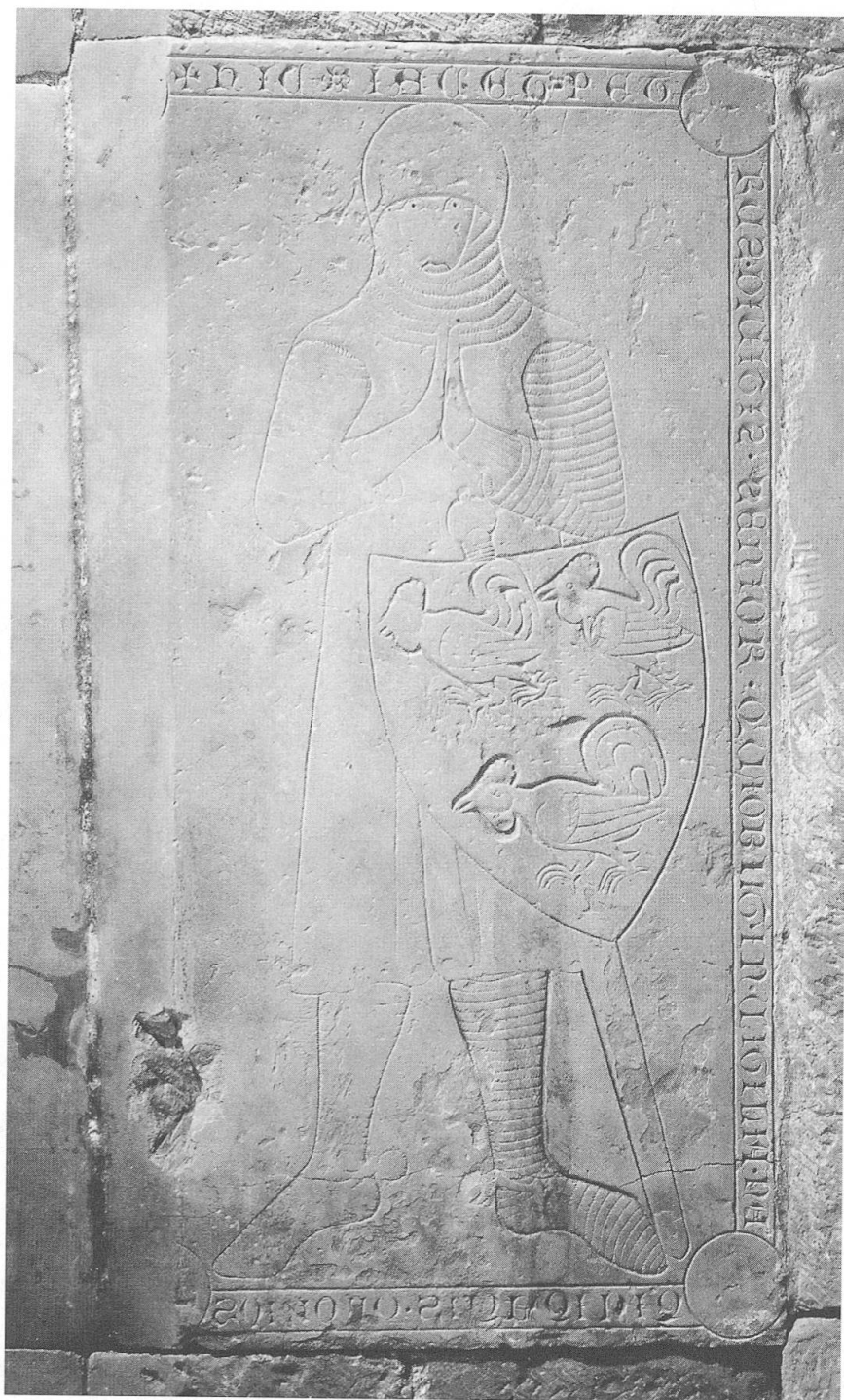
Abb. 2: Grabplatte aus Cahiers d'archéologie fribourgeoise 13 (2011), S. 210, Abb. 5.