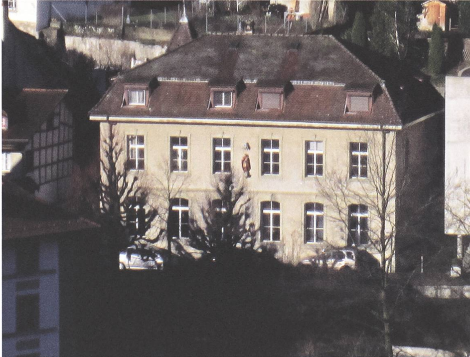
Abb. 4: Das Schulhaus in der Lenda vom «Petit Montreux» aus.