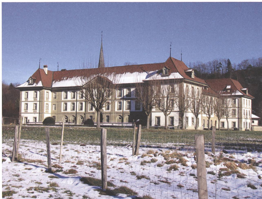
Abb. 2: Altenryf, damals Sitz des Lehrerseminars.