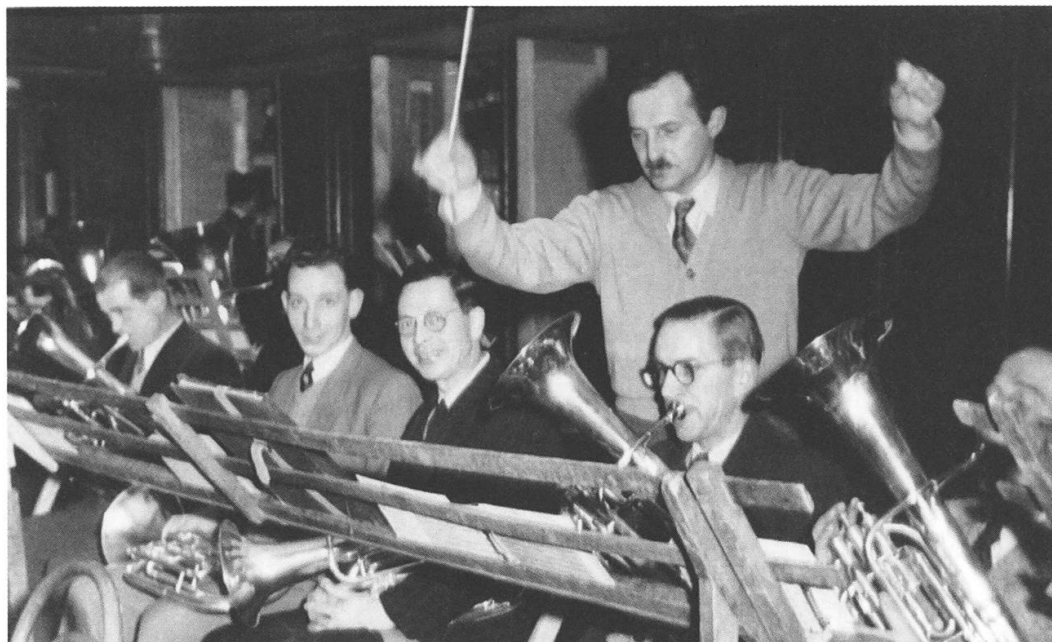
Abb. 7: Probe mit Instrumentalsolisten.

des Internationalen Musikbundes in Reims. Sein Lehrbüchlein: L'Introduction aux exercices de solfège soll laut Oswald Schneuwly häufig in den Notenschränken verstaubt sein ... Daneben schuf er mit Schubert'schem Fleiss 600 Kompositionen 38 , sakrale und weltliche Vokalmusik: Messen, Festspiele, Lieder. Auch hier arbeitete er gratis, ja er bezahlte sogar Studenten, um die Stücke für die Vereine abzuschreiben beziehungsweise zu vervielfältigen.