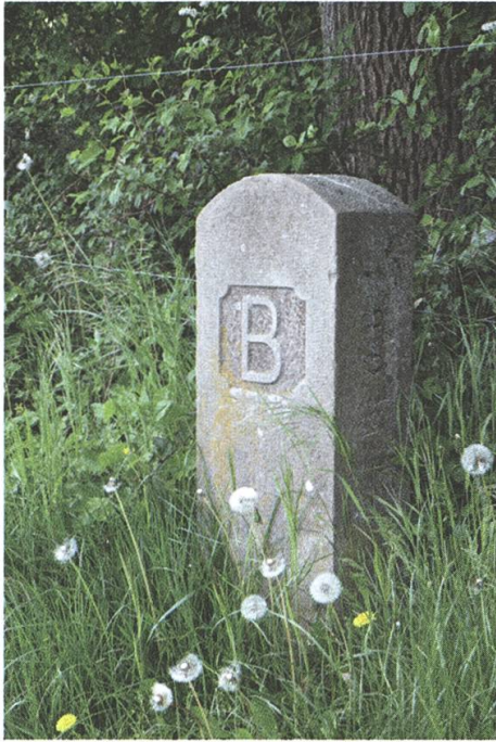
Abb. 8: Stein Nr. 22A, ein Sandstein aus dem Jahr 1908. Segmentbogenabschluss, reliefierte Initiale B.