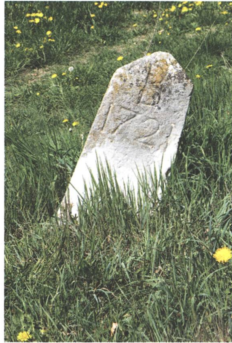
Abb. 9: Bern wankt! Die Serie von 1721 zeigt oft einen dachgiebelartigen Abschluss. Stein Nr. 38.