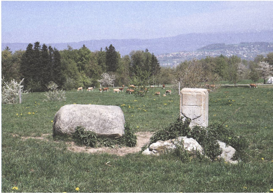
Abb. 5: Grenze zwischen Chandossel/La Solitude und Clavaleyres/Oberer Hubel. Sicht gegen Norden, mit Vully und Jura. Der Marchstein Nr. 11 nach dem Plan von 1882, bezeichnet Nr. 43, aus weissem Jurakalk von 1760 zeigt südwärts das Freiburger Wappen, nordwärts den Berner Bären. Sein Vorgänger war vermutlich, noch vor Samuel Bodmers Erhebung von 1710, ein «Feldstein» oder ein «wilder Stein» in Form eines Findlings, wie wir ihn hier noch antreffen.