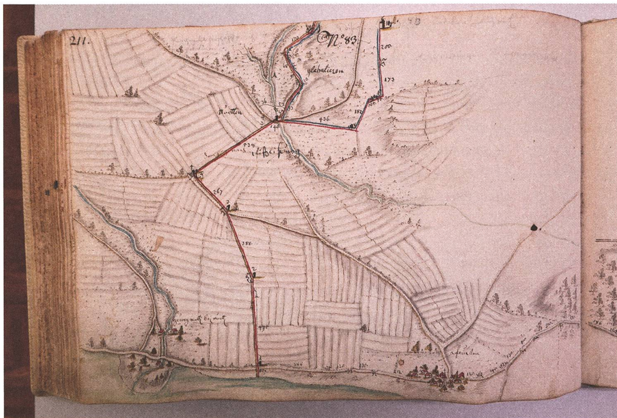
Abb. 4: Marchenatlas von Samuel Bodmer 1710, StABE, Plan AA IV, 4, Karte 83. Die südorientierte Karte zeigt die rotmarkierte Grenzlinie mit den Marchsteinen 1–6 vom Ufer des Murtensees zwischen Greng (Gemeine Herrschaft Murten) und Pfauen/Faoug (Landvogtei Wifflisburg/Avenches) bis zum Territorium der Gemeinde Clavaleyres /Glebalieren, das blau umrandet ist. Der Marchstein Nr. 5 (nach der heutigen Liste Nr. 32) ist ein «Dreiländerstein», der heute älteste Grenzstein der Region. Der nächste Marchstein ist die Nr. 6 (ganz oben rechts), nach einem gezackten Grenzverlauf, der nebst den Distanzen auch die Winkel angibt.

tant l'écusson fribourgeois, l'initiale V, la date de 1654 et le no 22 de la série entre Clavaleyres et Faoug» 18 , heute durch einen Stein von 1924, den jüngsten des Bestandes, ersetzt; das nachträglich angebrachte V auf dem Vorgängerstein markierte natürlich die 1803 erfolgte Gründung des Kantons Waadt.