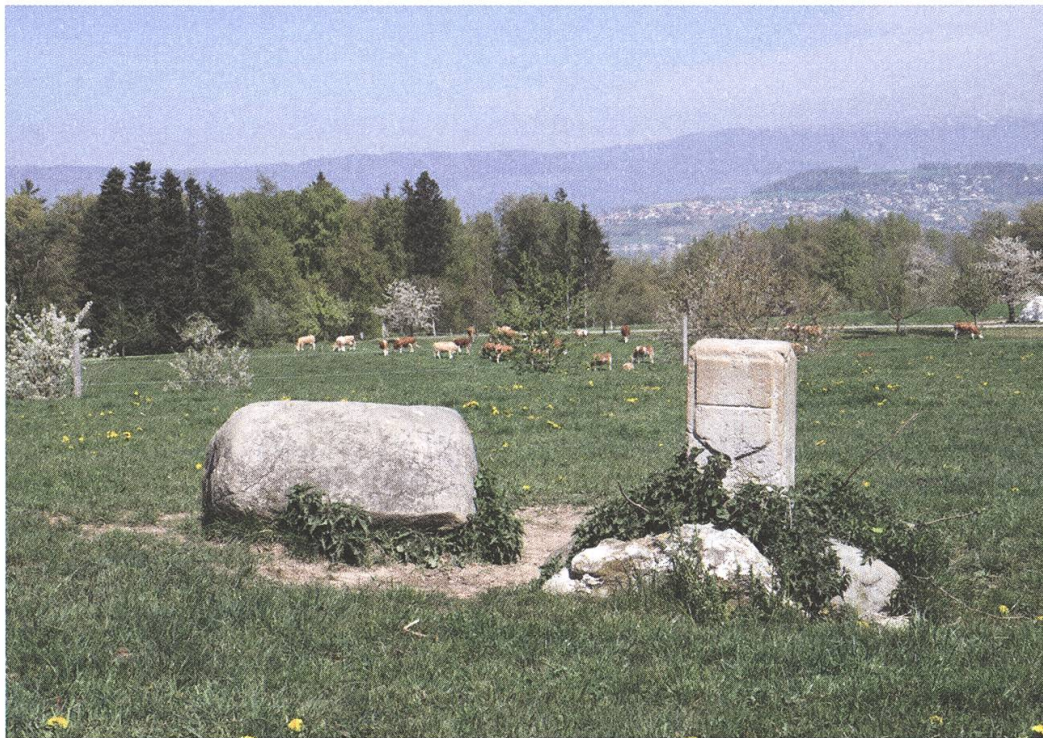
Abb. 5: Grenze zwischen Chandossel/La Solitude und Clavaleyres/Oberer Hubel. Sicht gegen Norden, mit Vully und Jura. Der Marchstein Nr. 11 nach dem Plan von 1882, bezeichnet Nr. 43, aus weissem Jurakalk von 1760 zeigt südwärts das Freiburger Wappen, nordwärts den Berner Bären. Sein Vorgänger war vermutlich, noch vor Samuel Bodmers Erhebung von 1710, ein «Feldstein» oder ein «wilder Stein» in Form eines Findlings, wie wir ihn hier noch antreffen.