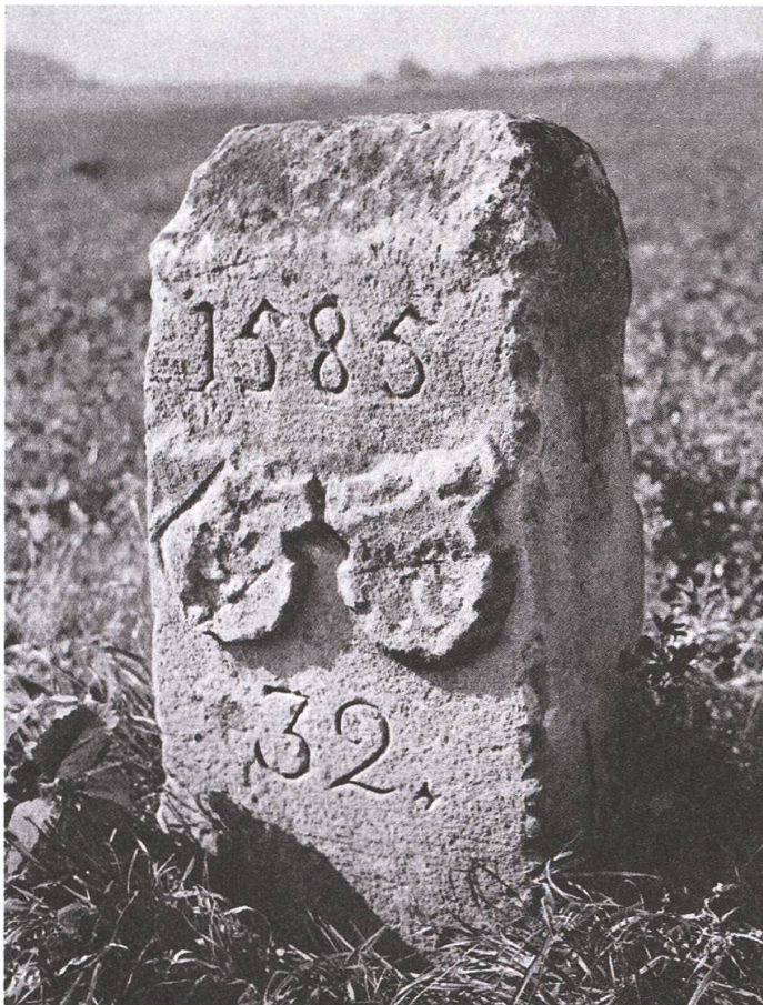
Abb. 10: Der älteste Grenzstein, Nr. 32, bei Bodmer Nr. 5, datiert 1585. Wapen beider Stände Bern und Freiburg (Gemeine Herrschaft Murten). Nach dem Autobahnbau ausgegraben, repariert und neu aufgestellt. Fotografie von Robert Marti-Wehren, 1946.