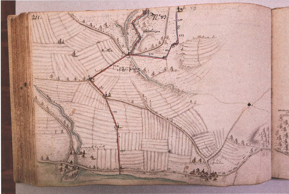
Abb. 4: Marchenatlas von Samuel Bodmer 1710, StABE, Plan AA IV, 4, Karte 83. Die südorientierte Karte zeigt die rotmarkierte Grenzlinie mit den Marchsteinen 1–6 vom Ufer des Murtensees zwischen Greng (Gemeine Herrschaft Murten) und Pfauen/Faoug (Landvogtei Wifflisburg/Avenches) bis zum Territorium der Gemeinde Clavaleyres /Glebalieren, das blau umrandet ist. Der Marchstein Nr. 5 (nach der heutigen Liste Nr. 32) ist ein «Dreiländerstein», der heute älteste Grenzstein der Region. Der nächste Marchstein ist die Nr. 6 (ganz oben rechts), nach einem gezackten Grenzverlauf, der nebst den Distanzen auch die Winkel angibt.

tant l'écusson fribourgeois, l'initiale V, la date de 1654 et le no 22 de la série entre Clavaleyres et Faoug» 18 , heute durch einen Stein von 1924, den jüngsten des Bestandes, ersetzt; das nachträglich angebrachte V auf dem Vorgängerstein markierte natürlich die 1803 erfolgte Gründung des Kantons Waadt.