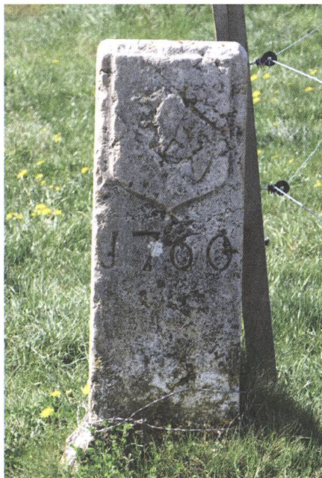
Abb. 6: Der benachbarte Stein Nr. 13, bez. Nr. 45, mit der Berner Seite derselben Serie.