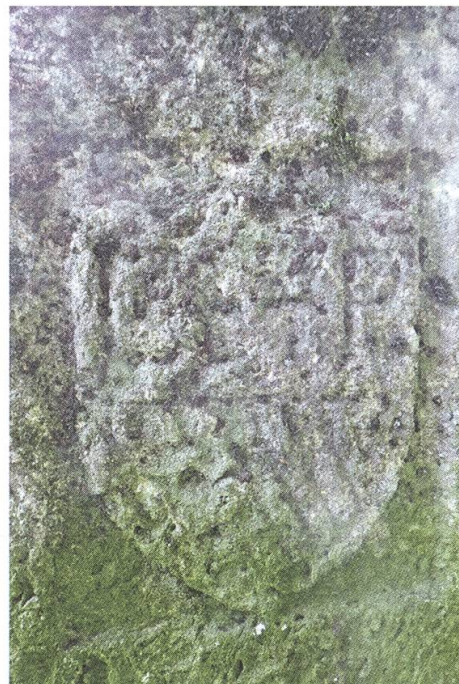
Abb. 7: Stein Nr. 25 mit dem Wappen des Kantons Waadt: L(iberté) ET P(atrie), untere Schildhälfte schraffiert (= Farbe Grün), nach 1803.