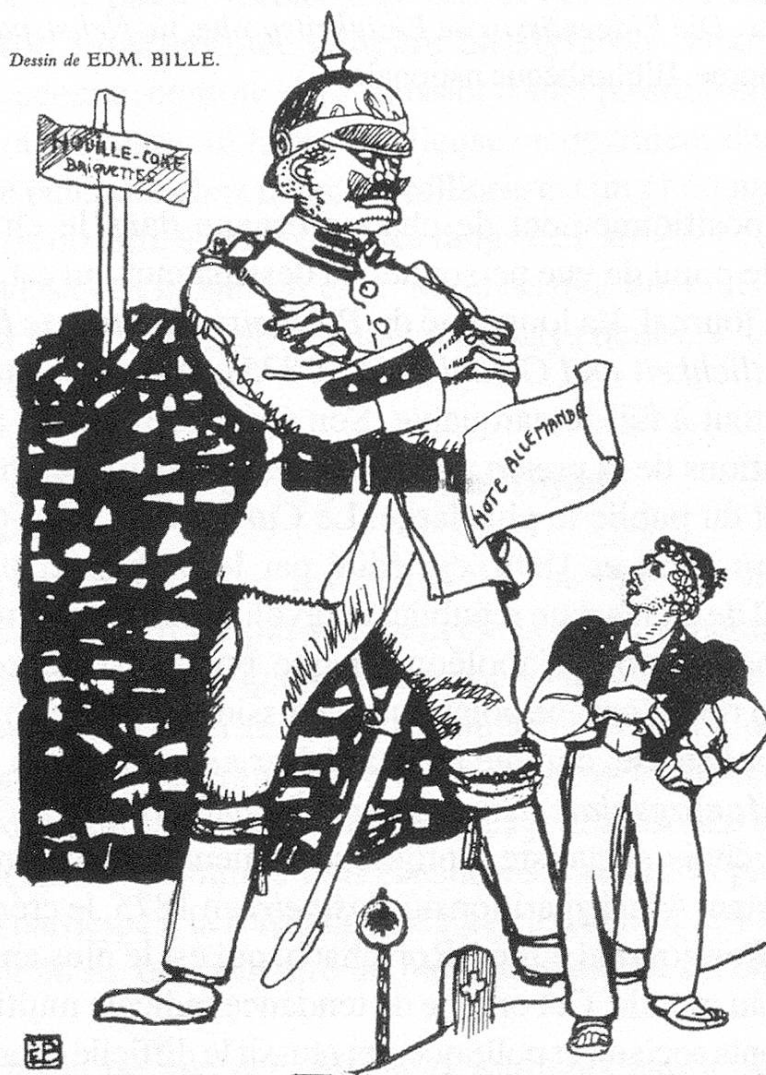
Fig. 3. Edmond Bille: La sommation , in: L'Arbalète , juillet 1916, zincographie, Lausanne, collection particulière.

A la suite de la Constitution de 1848, Helvetia se présente souvent sous les traits d'une figure antique assortie d'attributs au sens politique (bonnet phrygien,