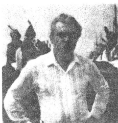
Sergej Bondartschuk bei Aufnahmen zu „Waterloo“

den wieder verjagt, stürmen wieder empor. Schon bedecken zehntausend Tote die lehmigen, nassen Hügel des leeren Landes und noch ist nichts erreicht als Erschöpfung hüben und drüben. Beide Heere sind müde, beide Feldherren beunruhigt. Beide wissen, dass dem der Sieg gehört, der zuerst Verstärkung empfängt, Wellington von Blücher, Napoleon von Grouchy." (S.Zweig) Gegen 7 Uhr abends erscheint Blücher als erster und die Schlacht von Waterloo ist entschieden. Marschall Grouchy hätte es in der Hand gehabt - aber aus Pflichtgefühl weigerte er sich entgegen einem schriftlichen Befehl auf's Schlachtfeld